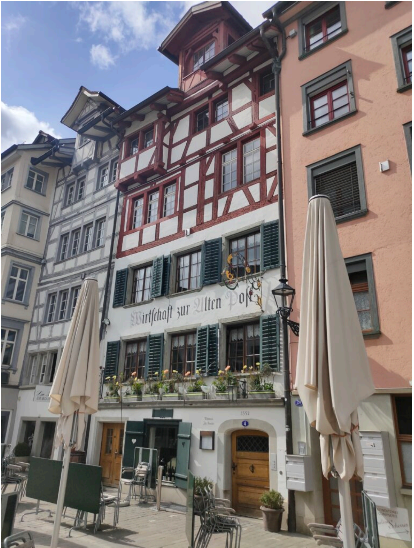
Altstadt Wirtschaft zur alten Post, Gallusstrasse