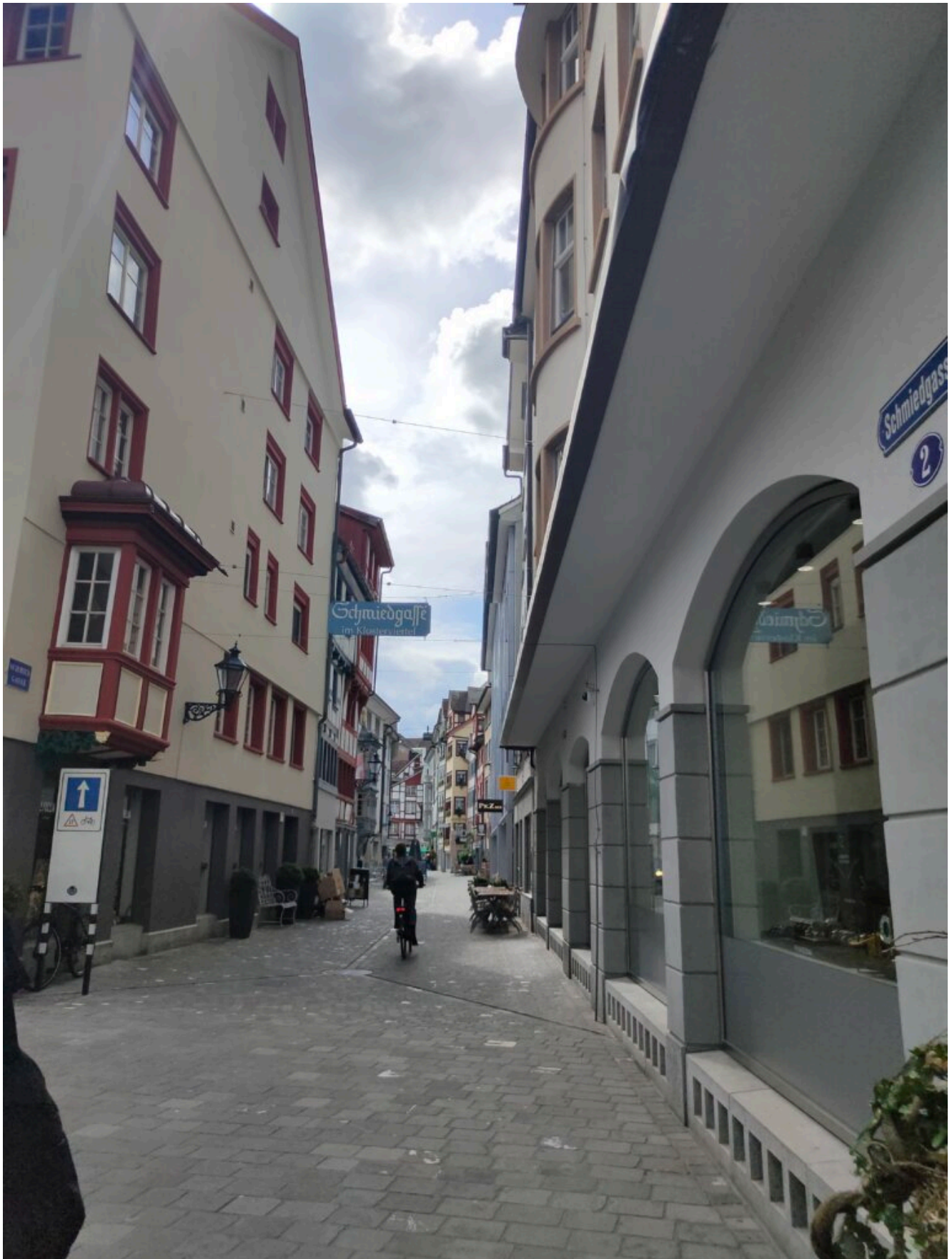
St. Gallen Altstadt