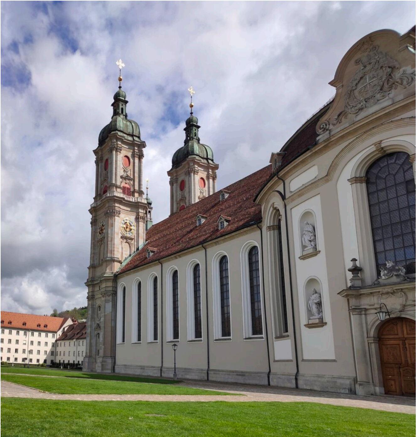
Stiftskirche St. Gallen