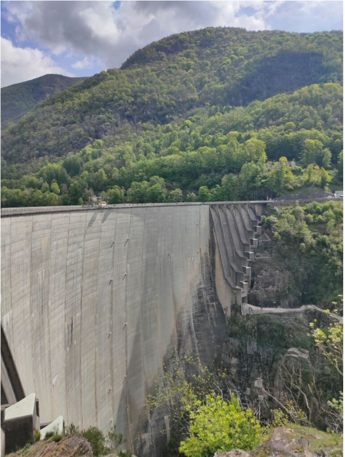
Staumauer Golden Eye

Doch entlang des gesamten Tales sind wunderbare Wanderwege, Rastplätze und Fahrradwege. In manchen Orten hat man das