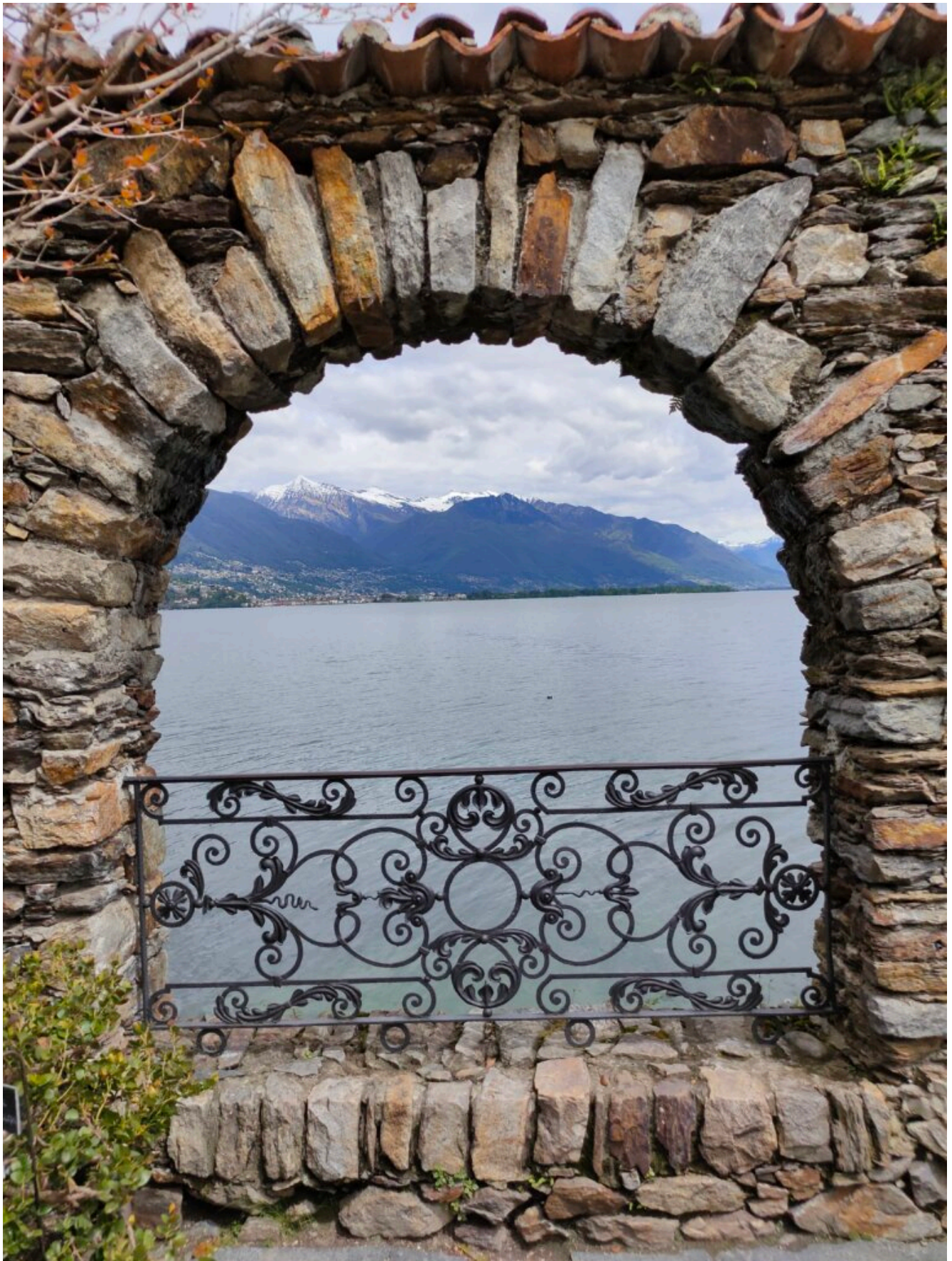
Blick auf Lago Maggiore