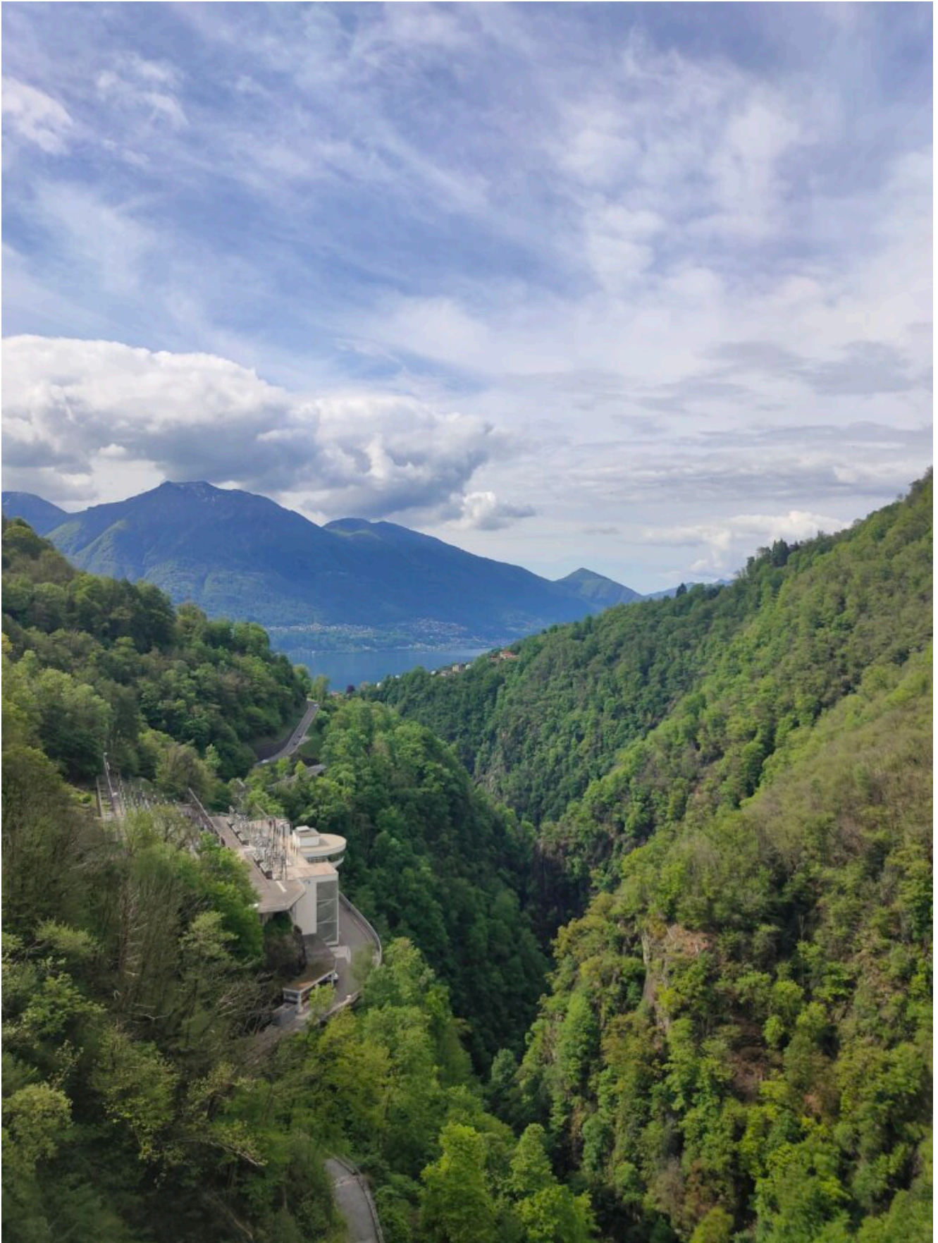
Blick in die Schlucht