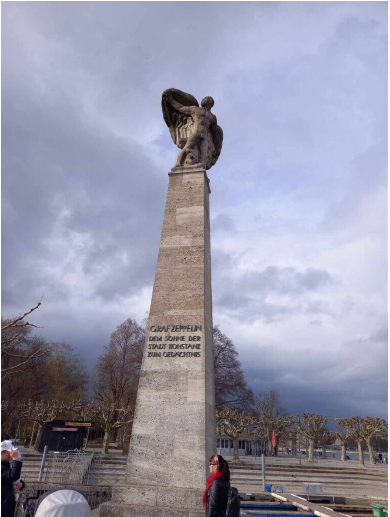
Graf Zepelin Gedächtnissäule