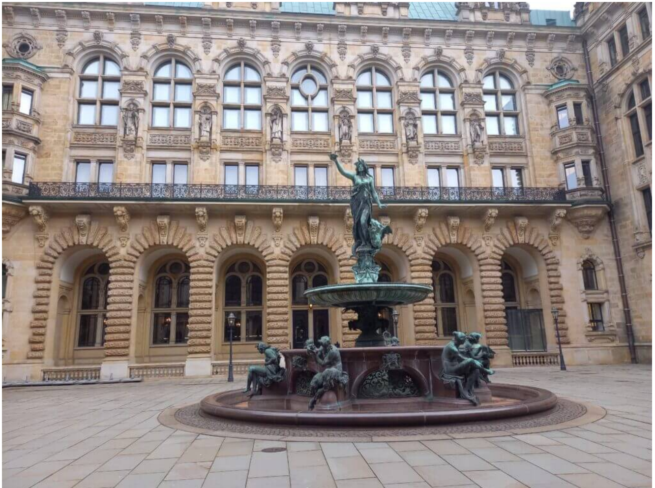
Hinterhof Rathaus Hamburg

Er war eine technische Sensation im Eröffnungsjahr 1911 in Deutschland. In 24 Meter Tiefe können Fußgänger, Fahrradfahrer und PKWs unter der Elbe durchfahren. Auf über 400 Meter Länge führen zwei Röhren mit einem Durchmesser von sechs Meter entlang. Heute steht er unter Denkmalschutz und aktuell können nur Passanten und Radfahrer hindurch.