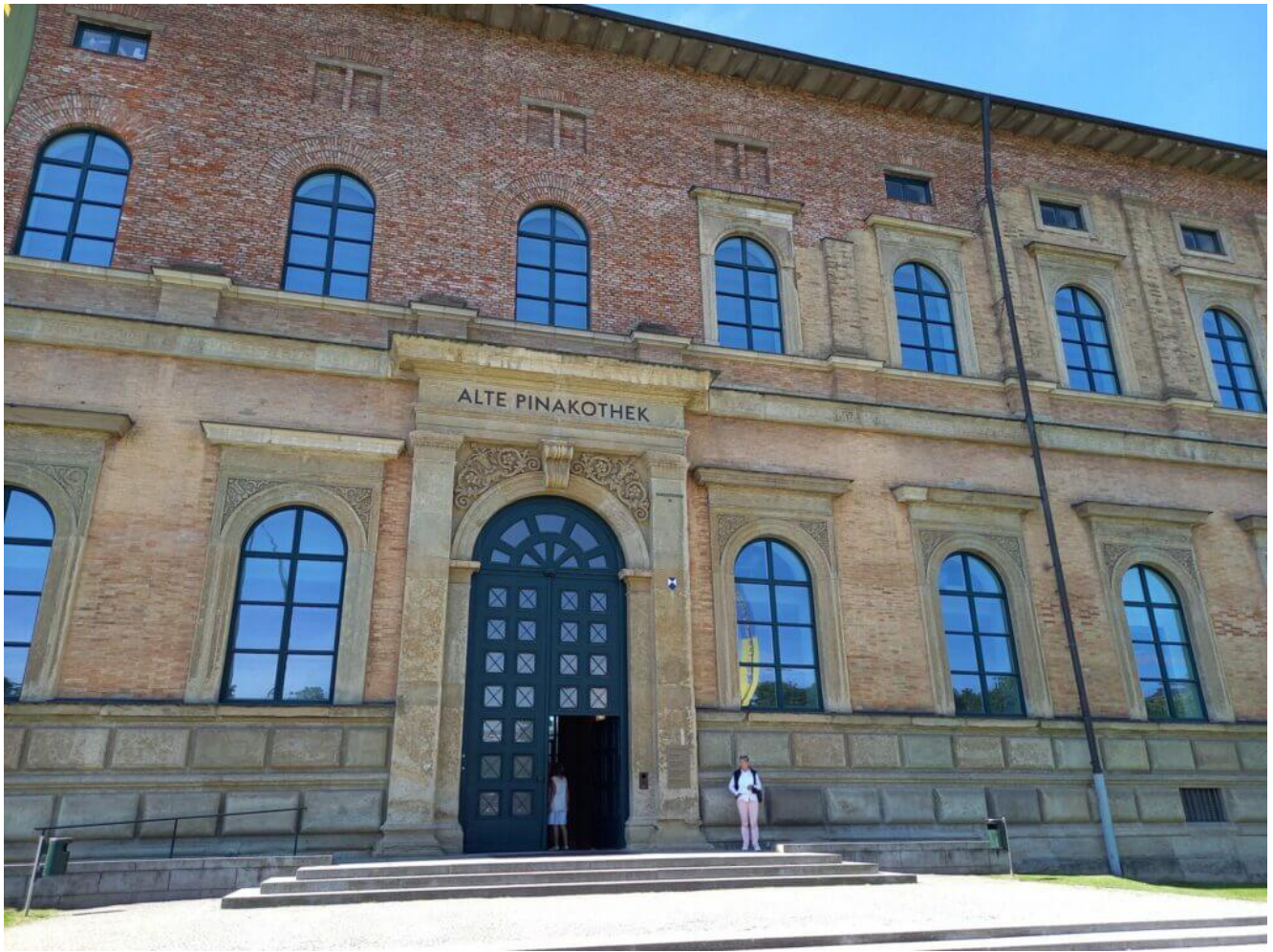
Die alte Pinakothek