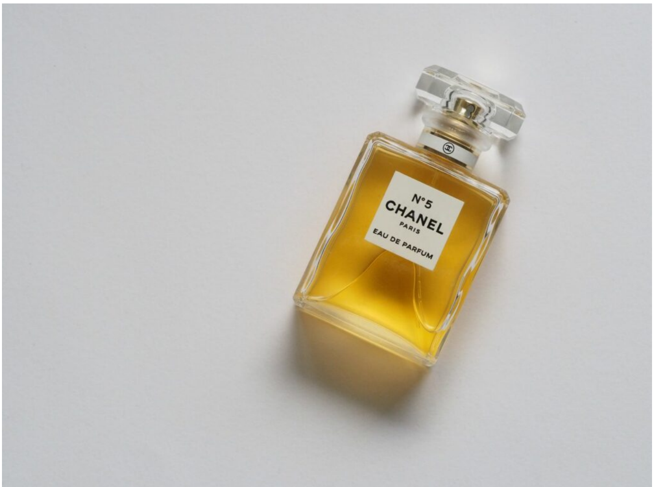
Coco Chanel Parfum