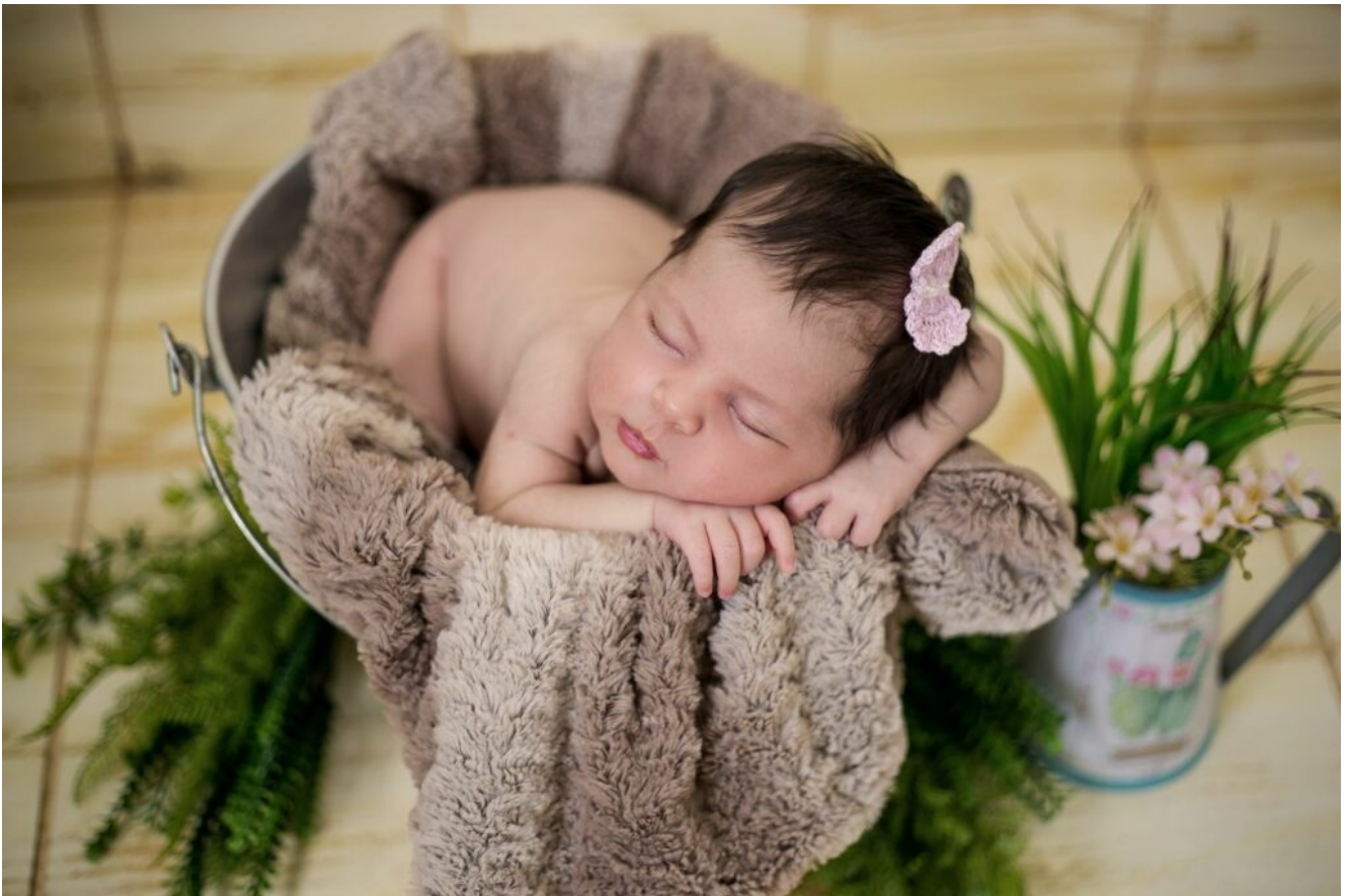
schlafendes Baby Jungennamen