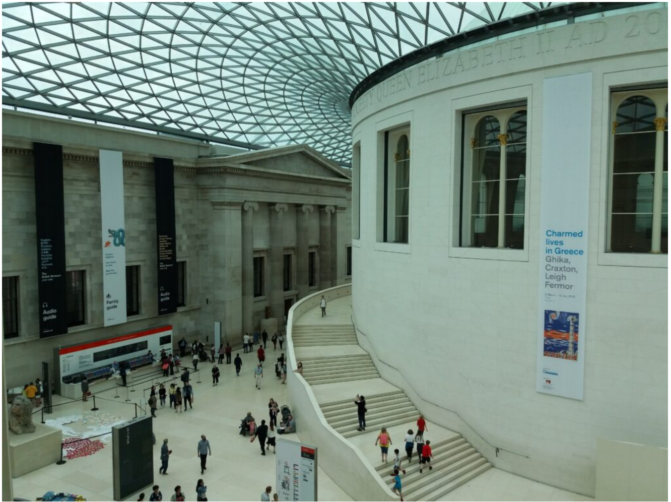
British Museum London