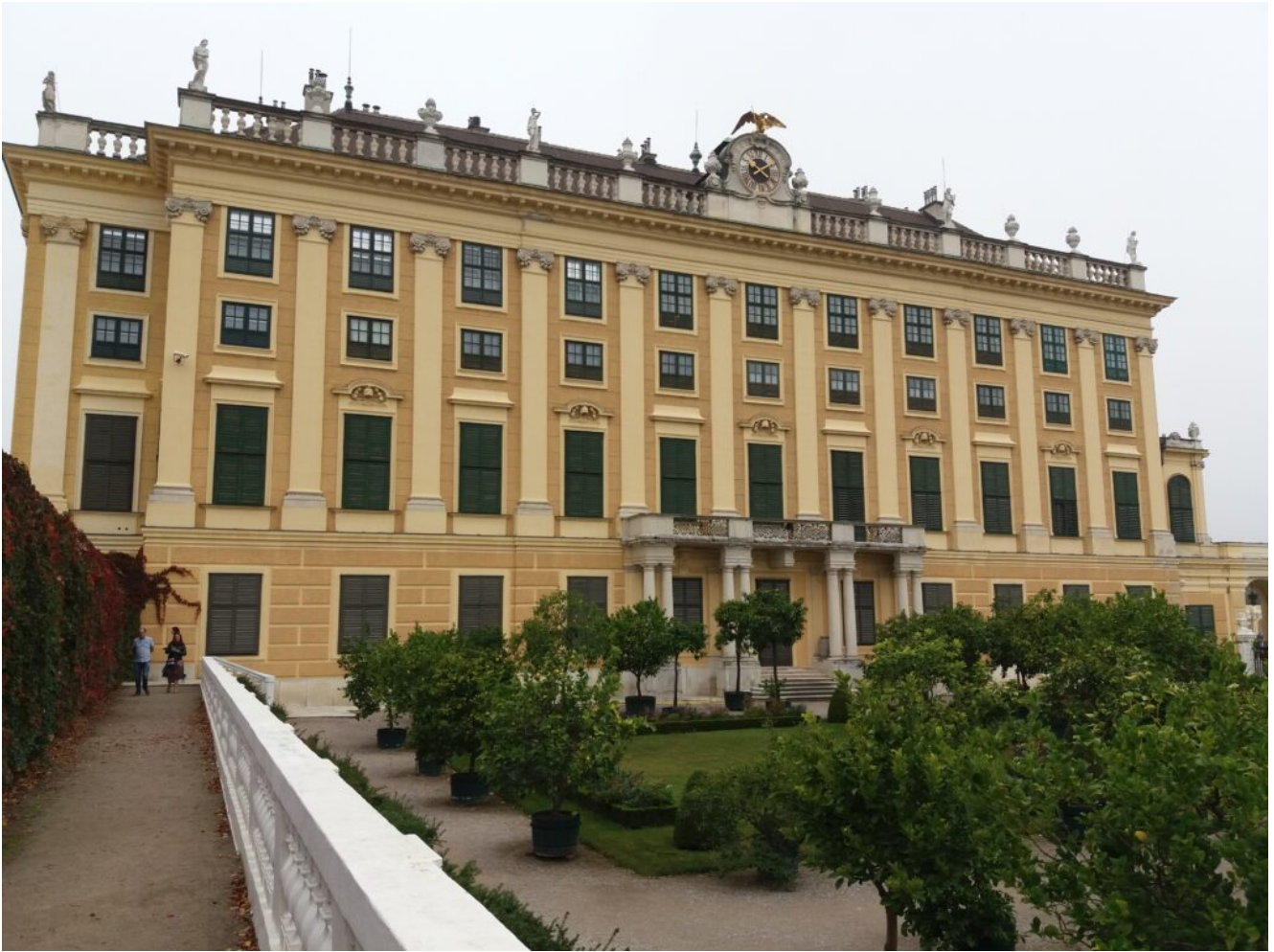
Schloß Schönbrunn Wien