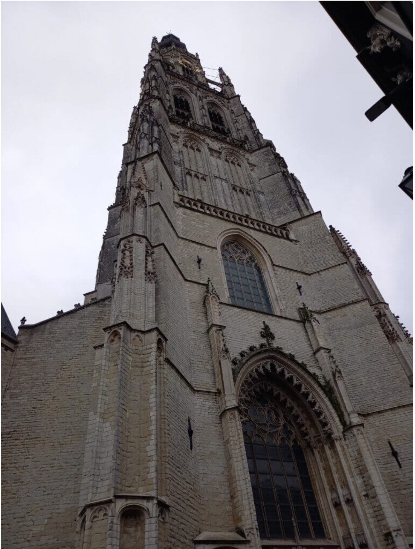
Das oude Stadhuis