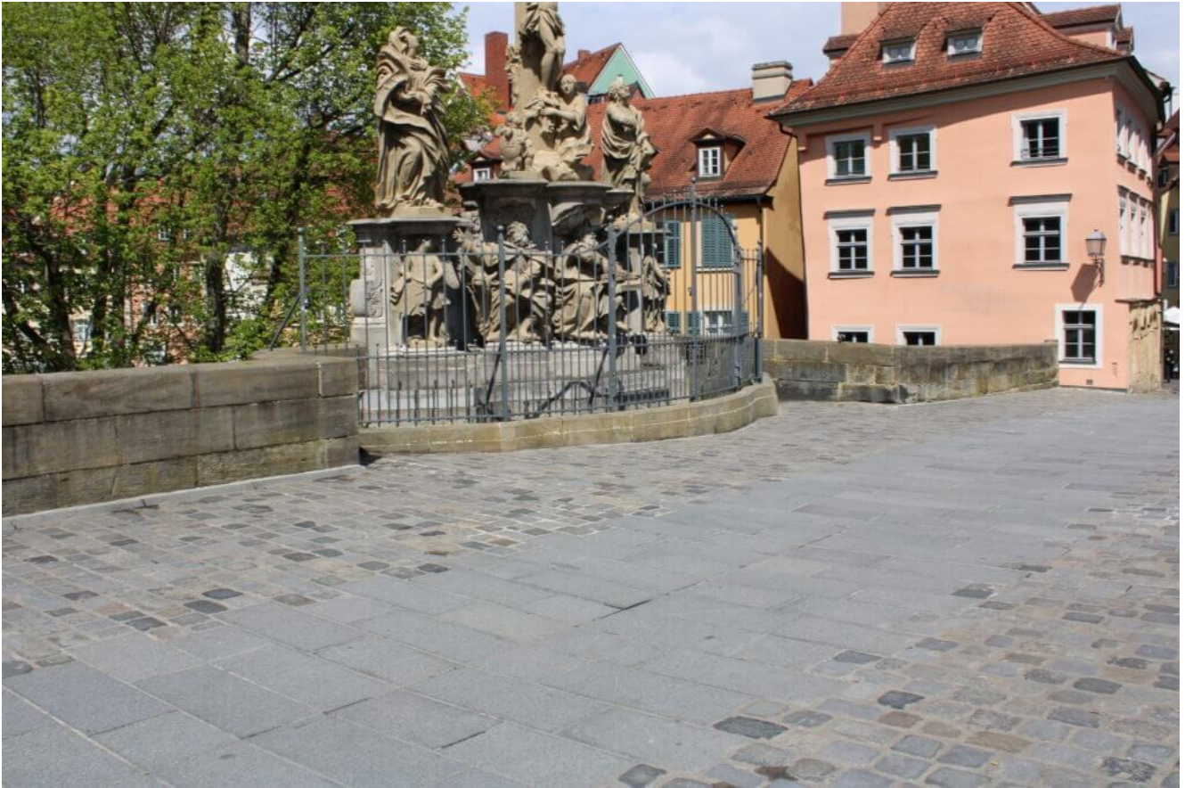
Skulpturen auf der steineren Brücke am alten Rathaus