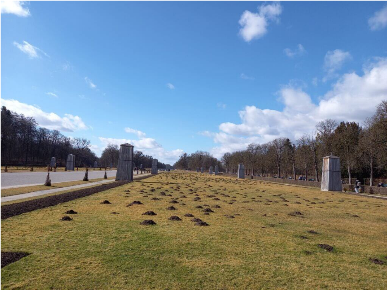
Der Park Schloß Nymphenburg