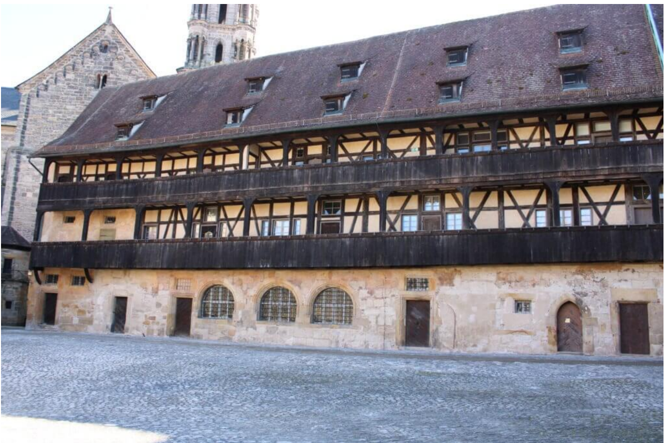
Die alte Hofhaltung