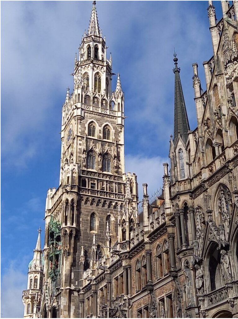
Das Münchner Rathaus