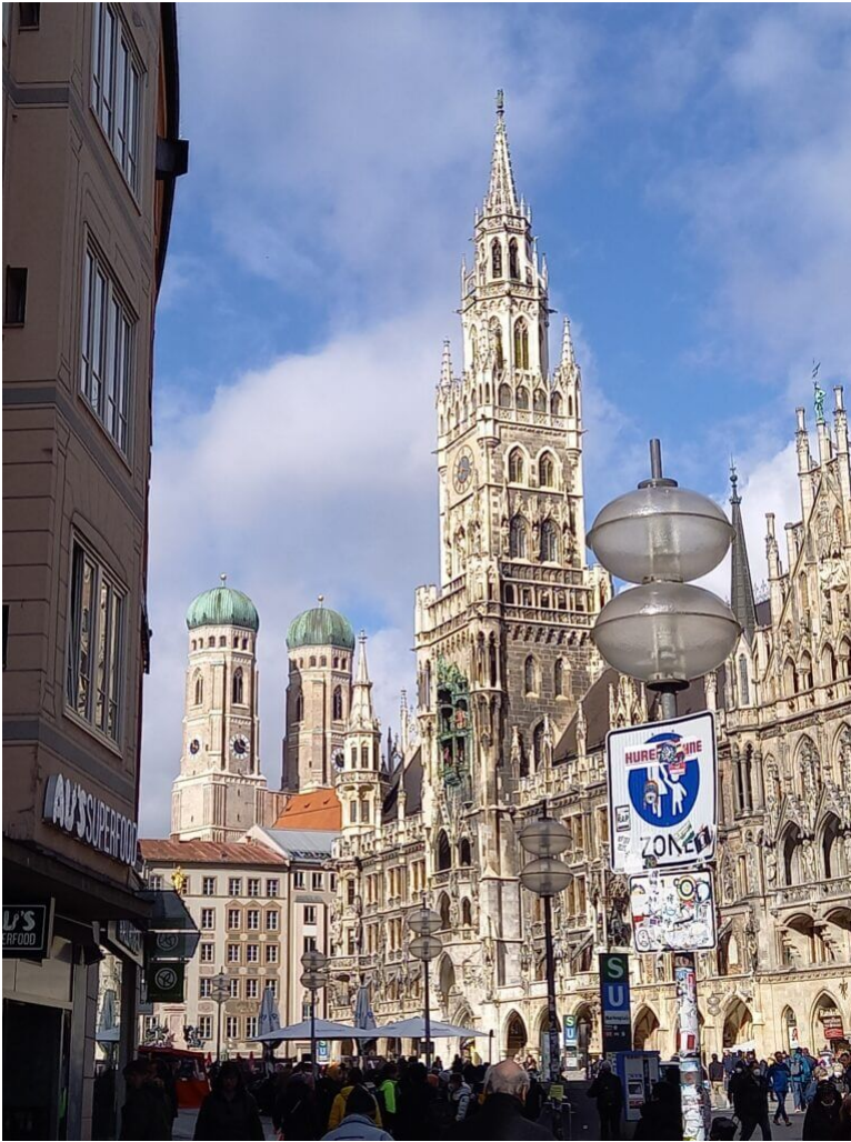
Marienplatz München Rathaus und Frauenkirche