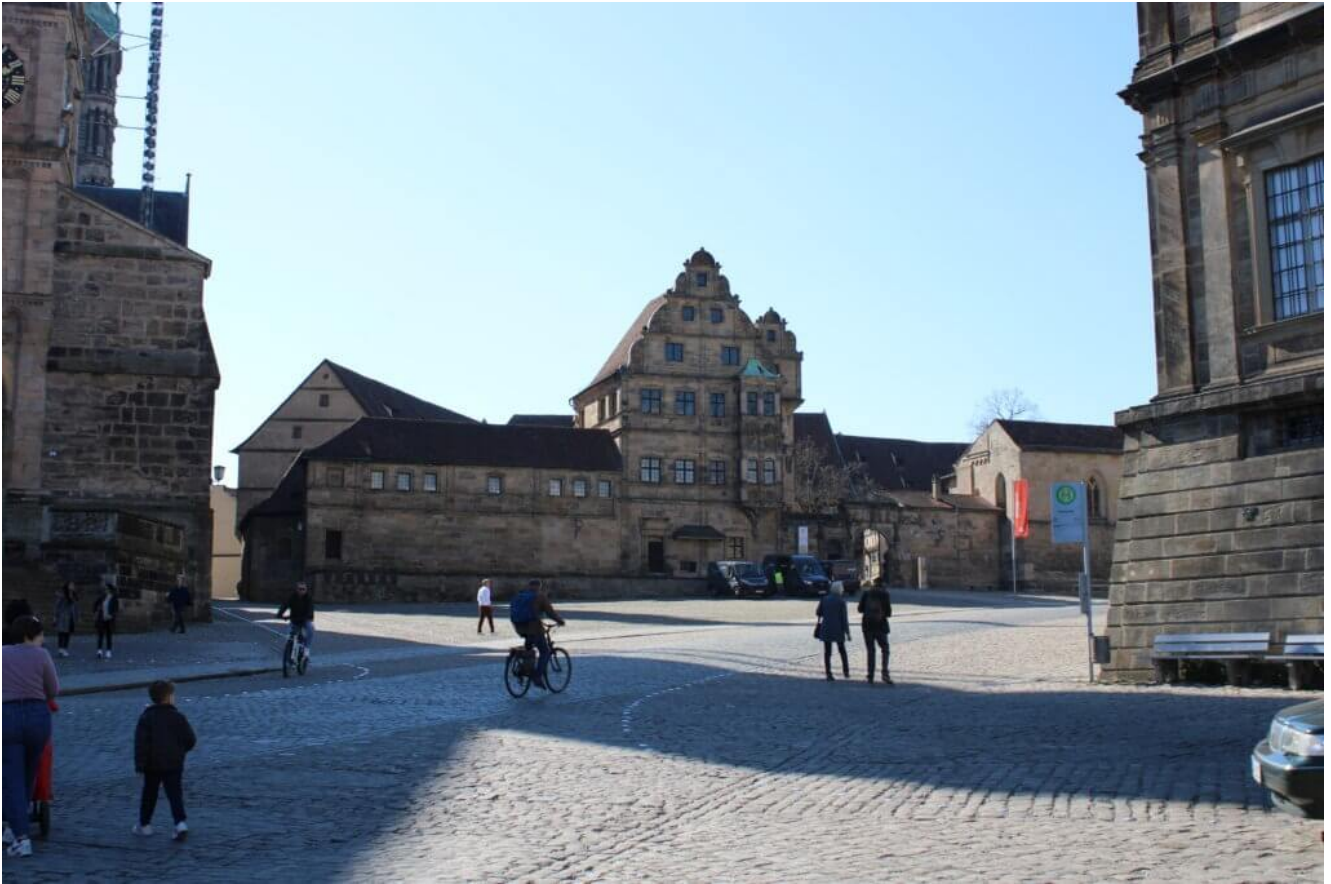
Domplatz Blick zur Alten Hofhaltung