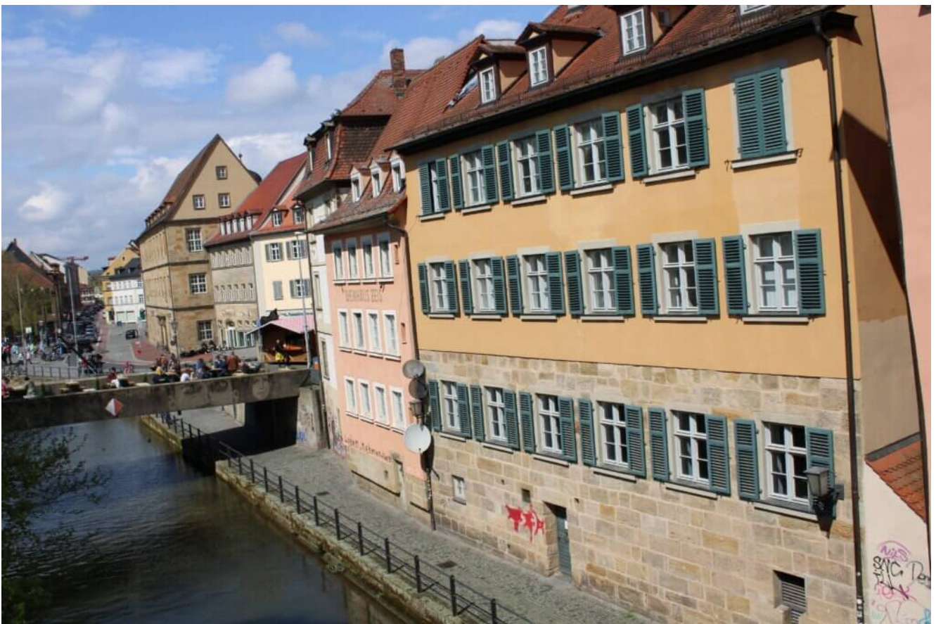
untere Brücke Bamberg