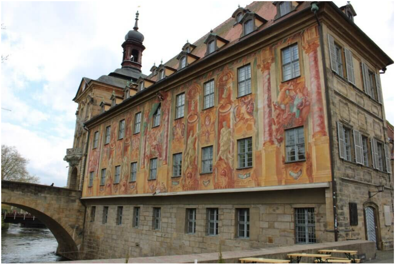
Das alte Rathaus