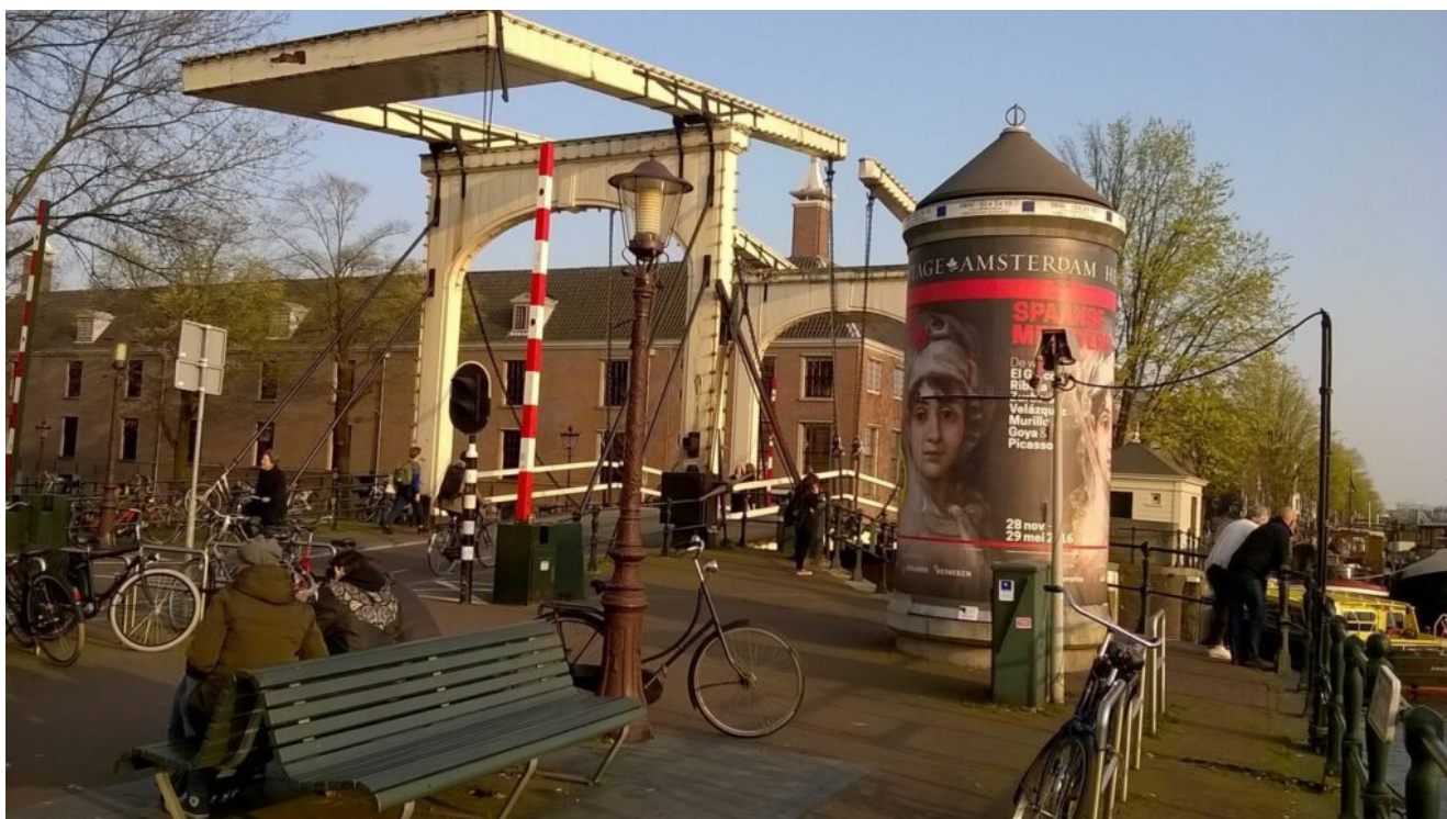
Magere Brug Amsterdam

In der Weihnachtswoche vom 20.12 bis 28.12.2025 kannst du mit zwei Urlaubstagen neun Tage frei nehmen. Geschickt kombiniert hast du vom 20.12.25 bis zum 04.01.2026 sechzehn Tage frei mit nur fünf Tagen Urlaub. In einigen Bundesländern ist der