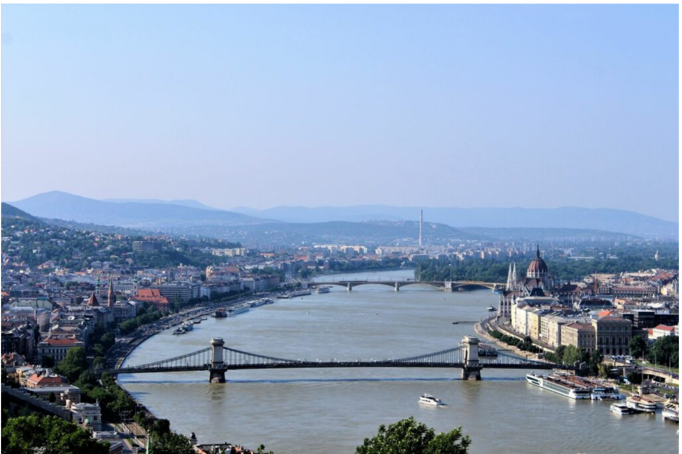
Ungarn Budapest Donau