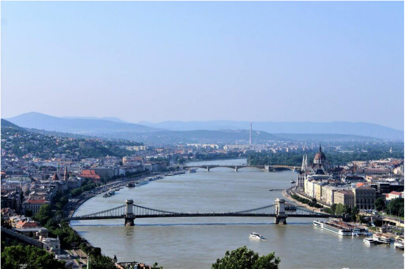
Ungarn Budapest Donau