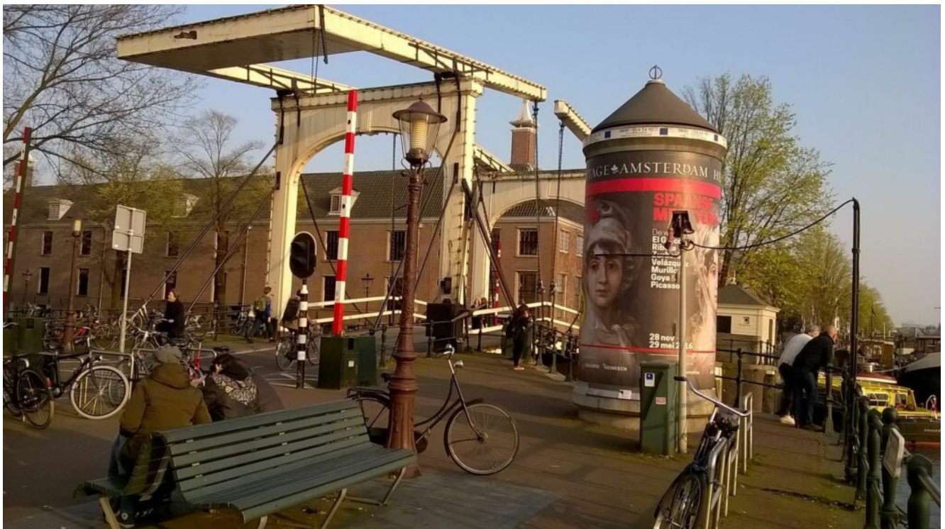
Magere Brug Amsterdam