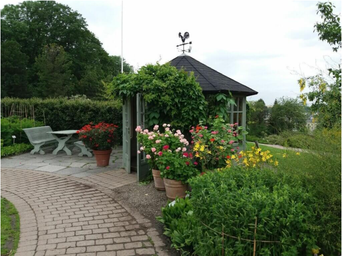
Oslo Botanischer Garten Teehaus