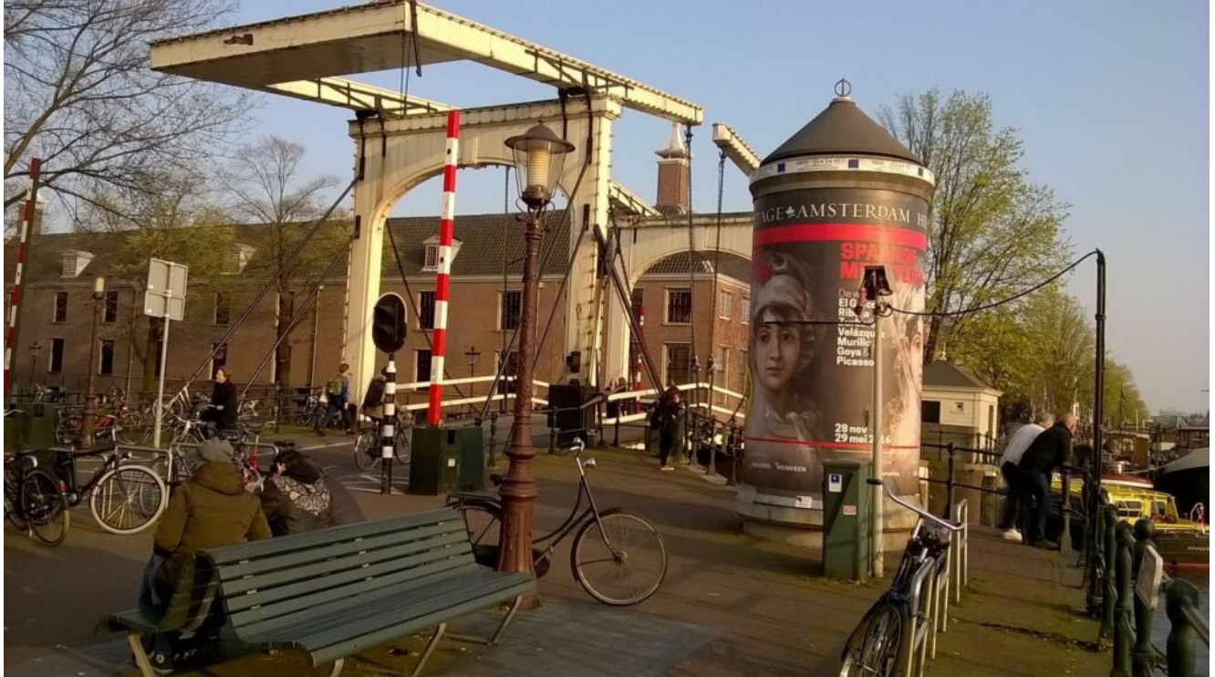
Magere Brug Amsterdam