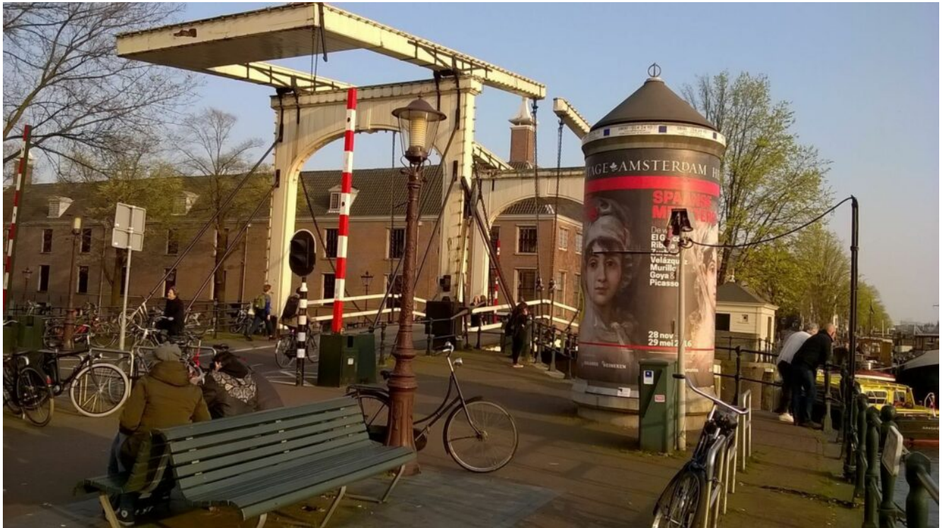
Magere Brug Amsterdam