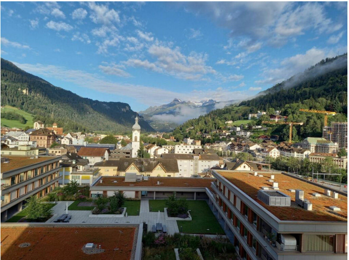
Ilanz Hotel Eden

Die Fahrt ging nach Ilanz *, mein Sohn arbeitet dort. Nachdem Hochsaison in der Schweiz herrscht, gab es kaum Übernachtungsmöglichkeiten.