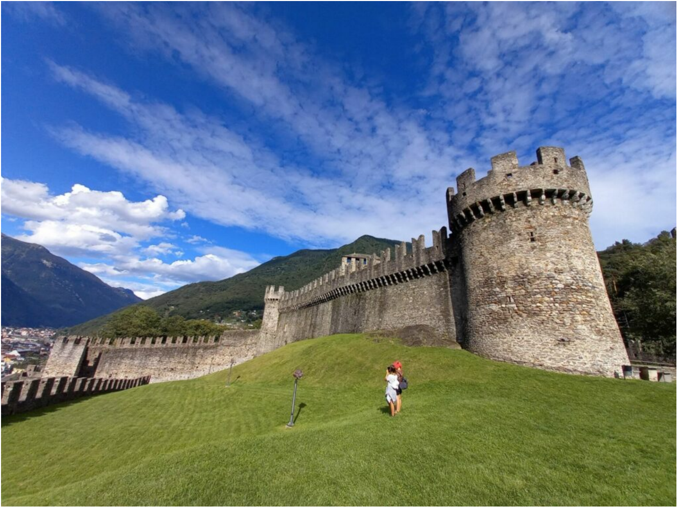
Unesco Weltkulturerbe Montebello