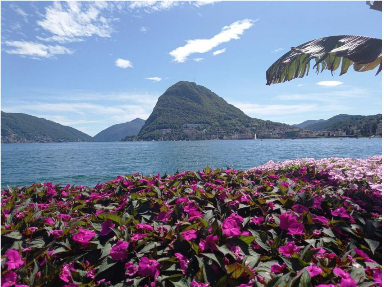
Der Zuckerhut vom Luganersee