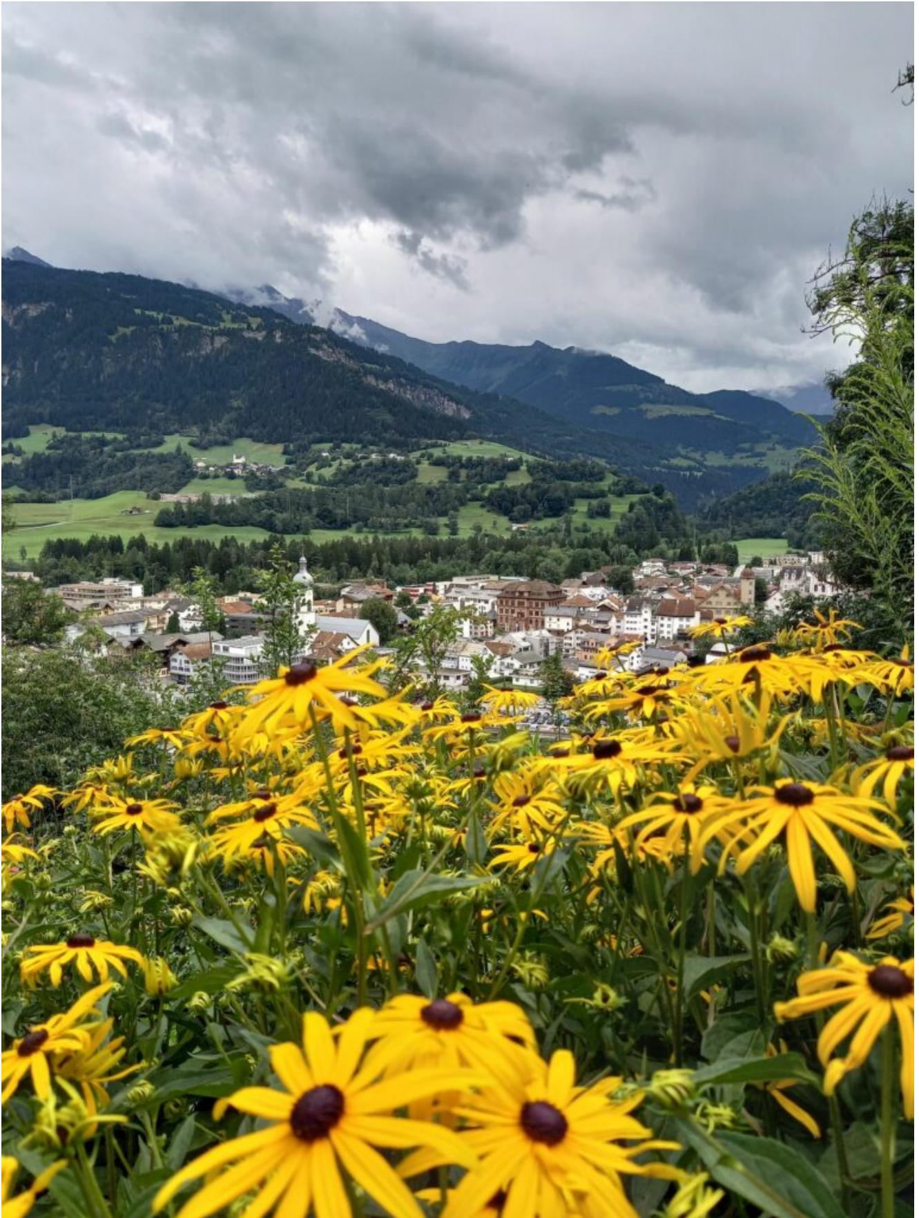
Blick auf Ilanz vom Kloster aus