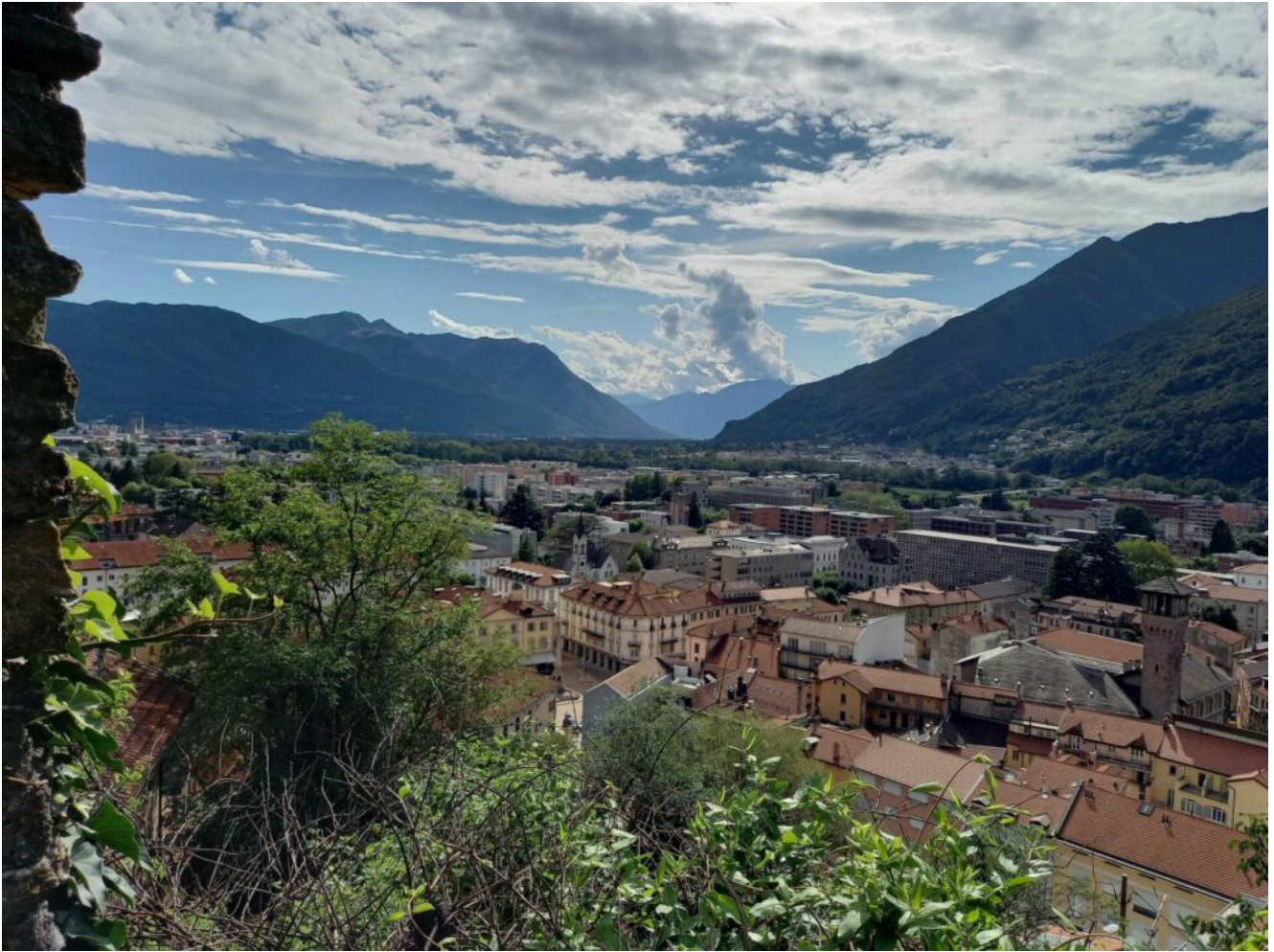
Blick auf Bellinzona