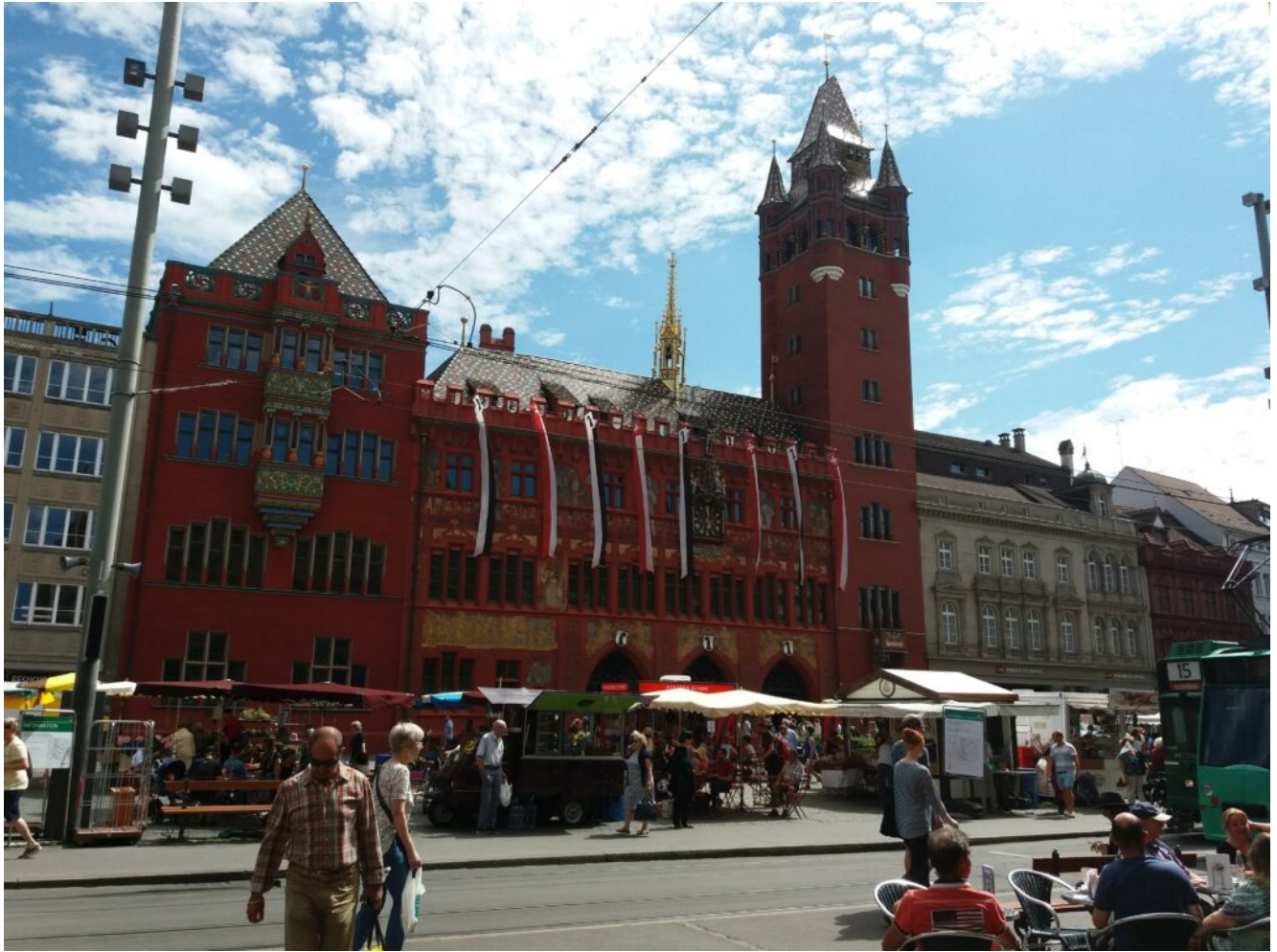
Rathaus von Basel