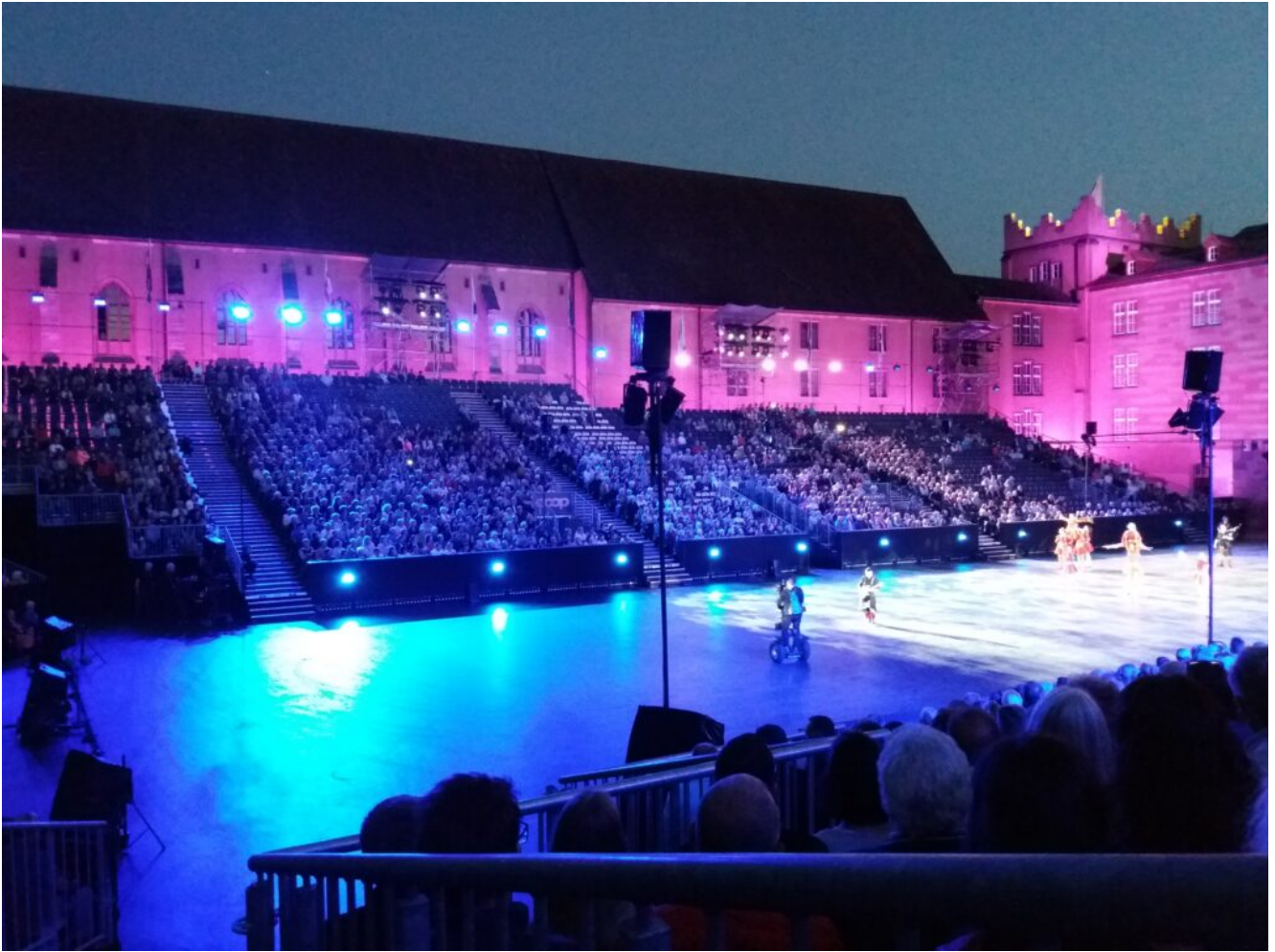
Das Basel Tattoo abends in der Kaserne