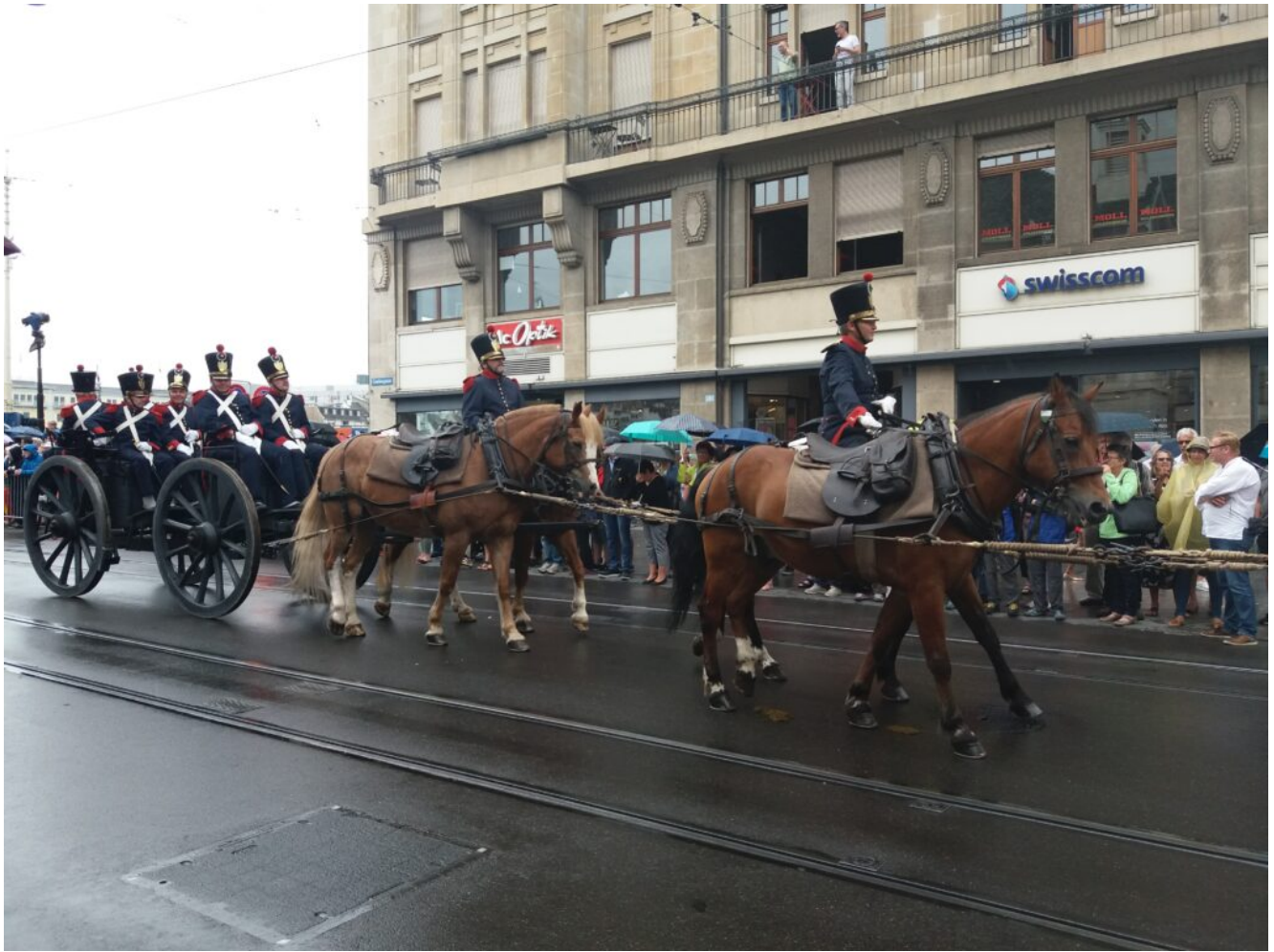
Der traditionelle Umzug Basel Tattoo