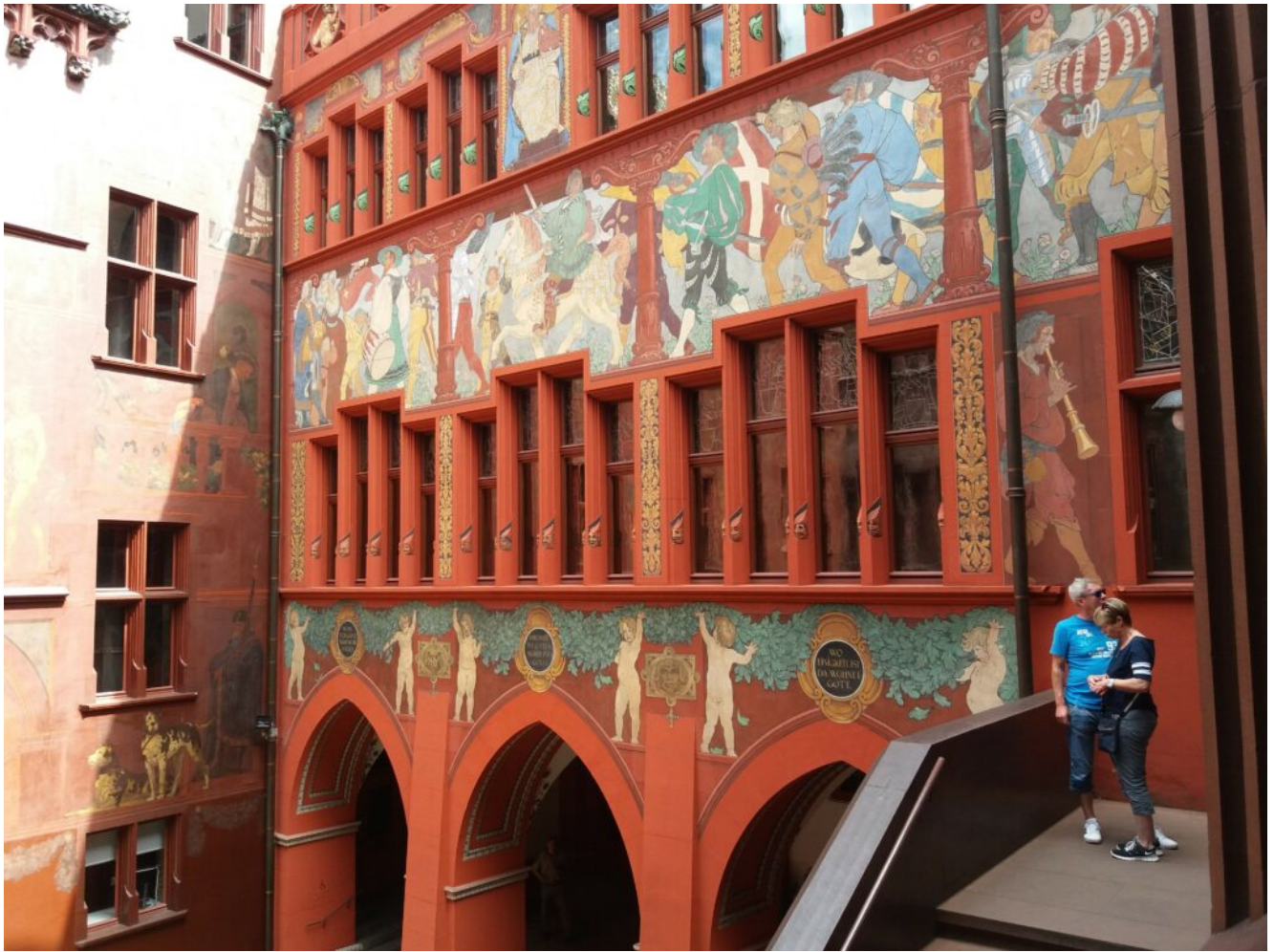
Basel Rathaus Innenhof