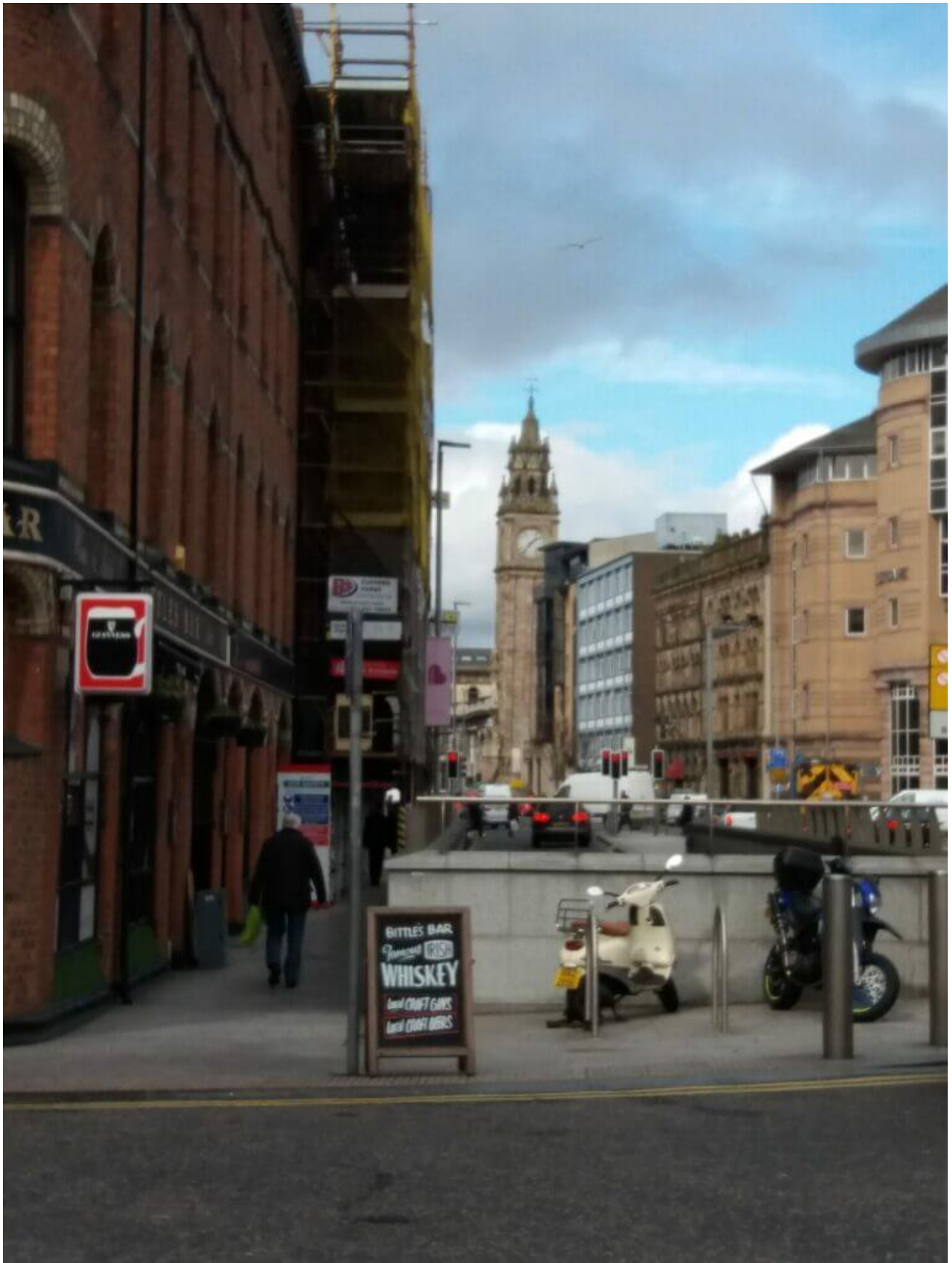
Linen Hall Library, die älteste Bibliothek Belfasts; the Grand Opera House ist ein Theater und der „Big Ben“ von Belfast, the Albert Memorial Clock Tower.