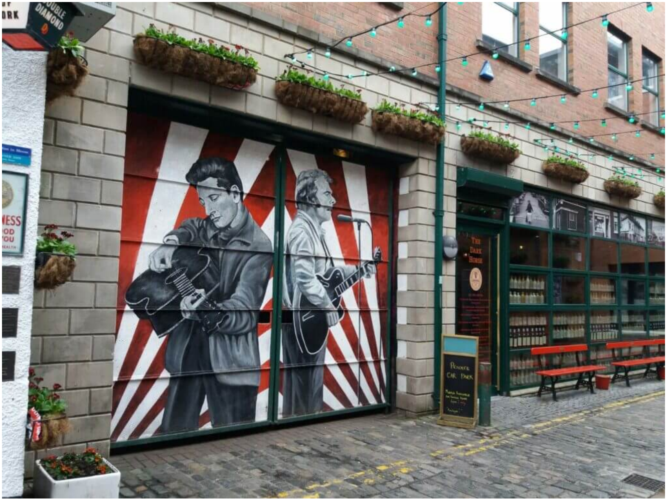
Markante Gebäude in Belfast