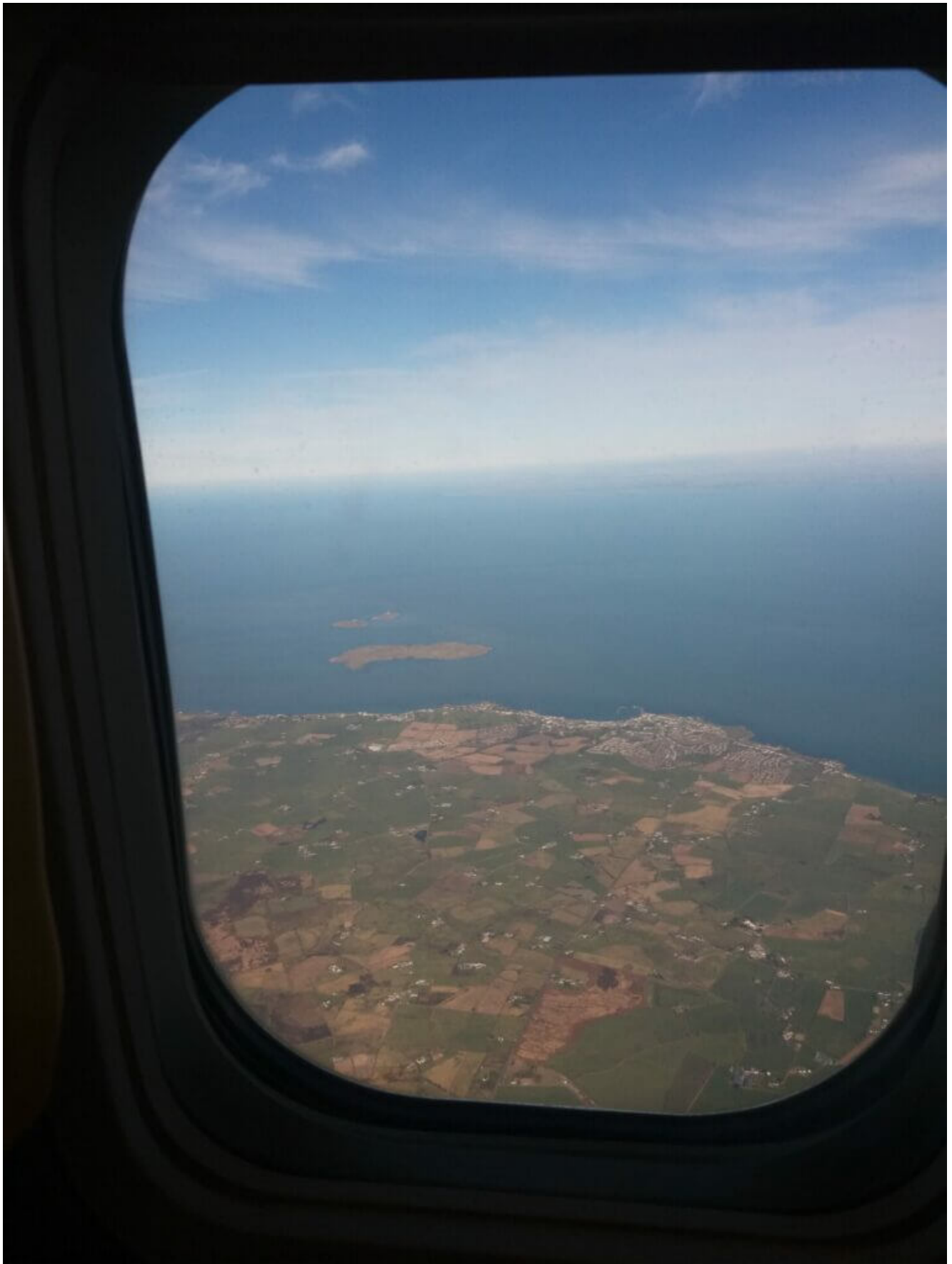
Blick aus dem Flieger...herrlich