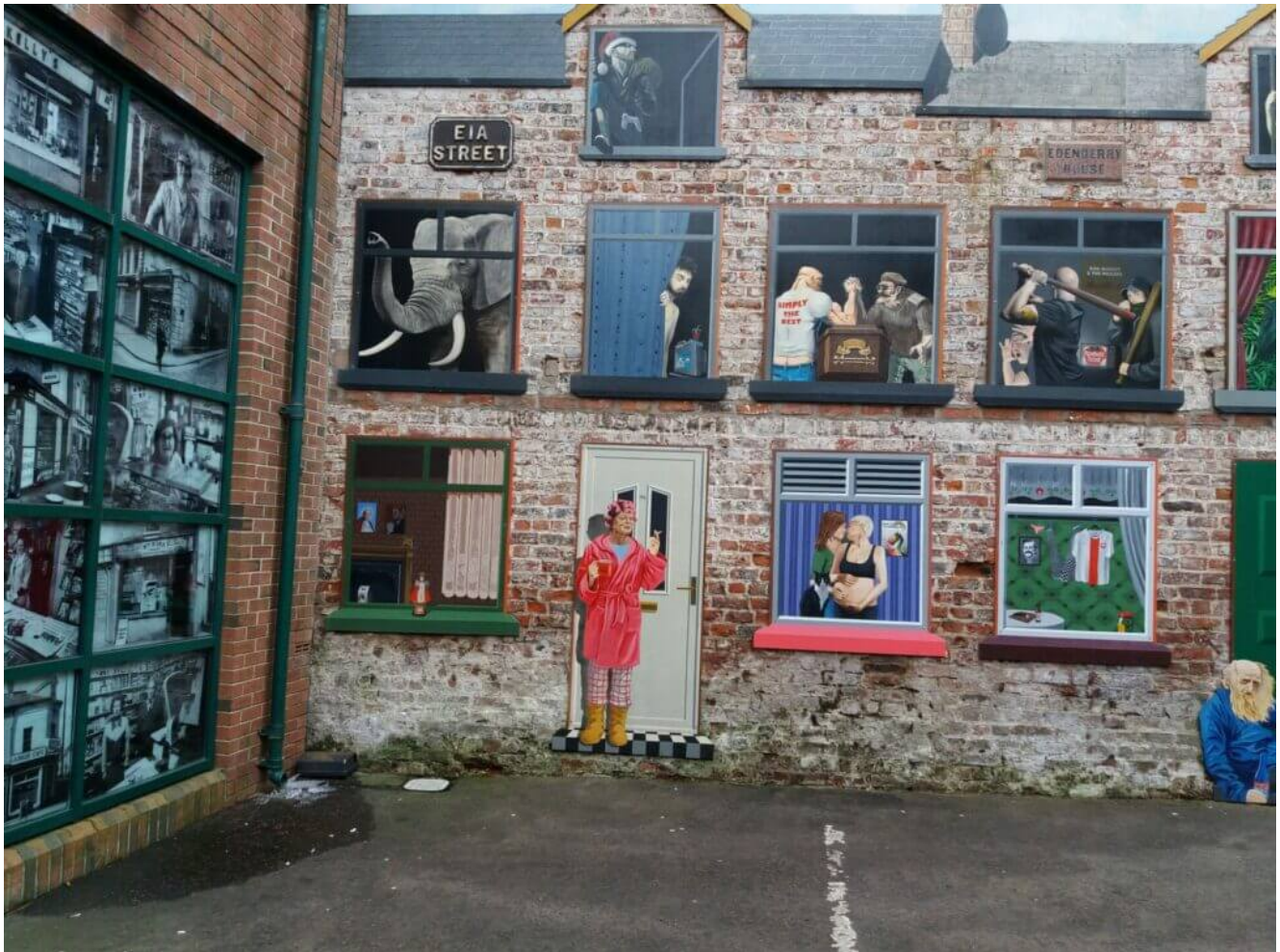
Bild unten: Rechts im Fenster sitzt die Lieblingshunderasse der Queen. Im ersten Stock, das vierte Fenster von links, ist eine Szene aus 50 Shades of Grey. Das dunkelhäutige Kind steht für ein Auswandererkind aus den ehemaligen Kolonien.

gedreht wurde. Und zum anderen Teil satirische Zeichnungen rund um das Königshaus oder andere Berühmtheiten.