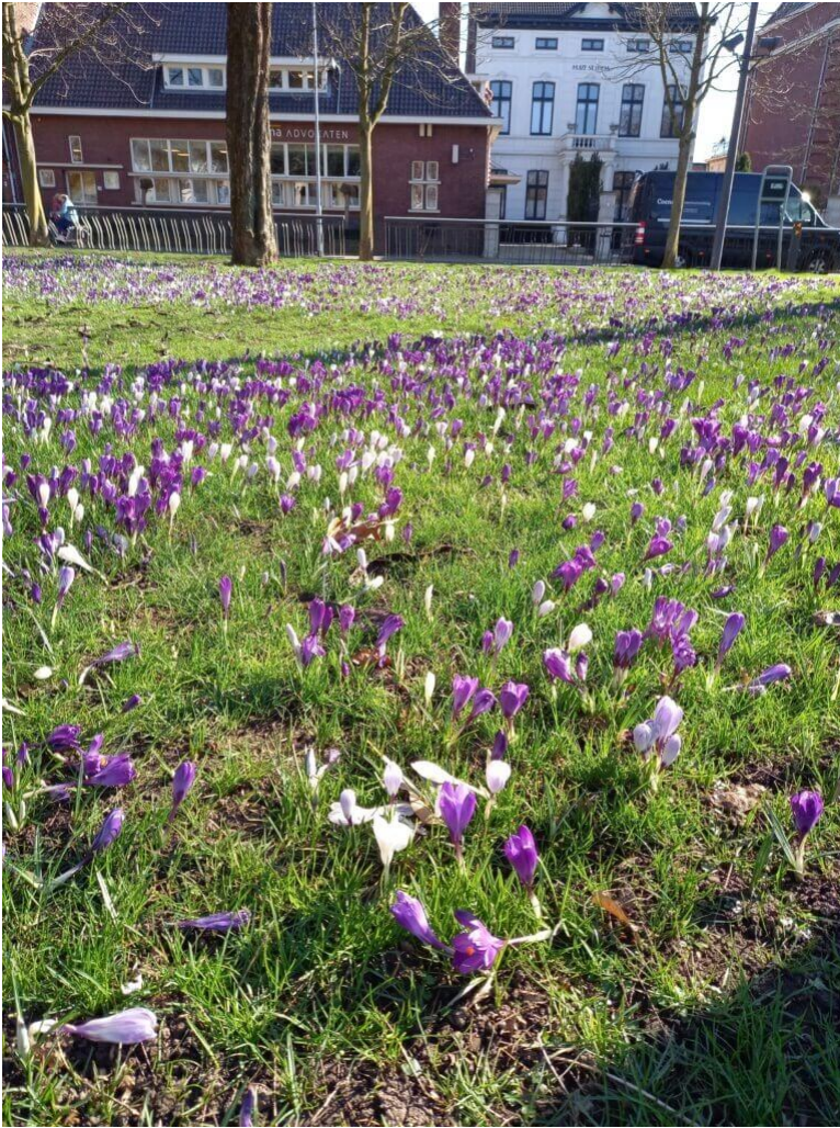
Blütenpracht im Park, wunderschöne Krokusse