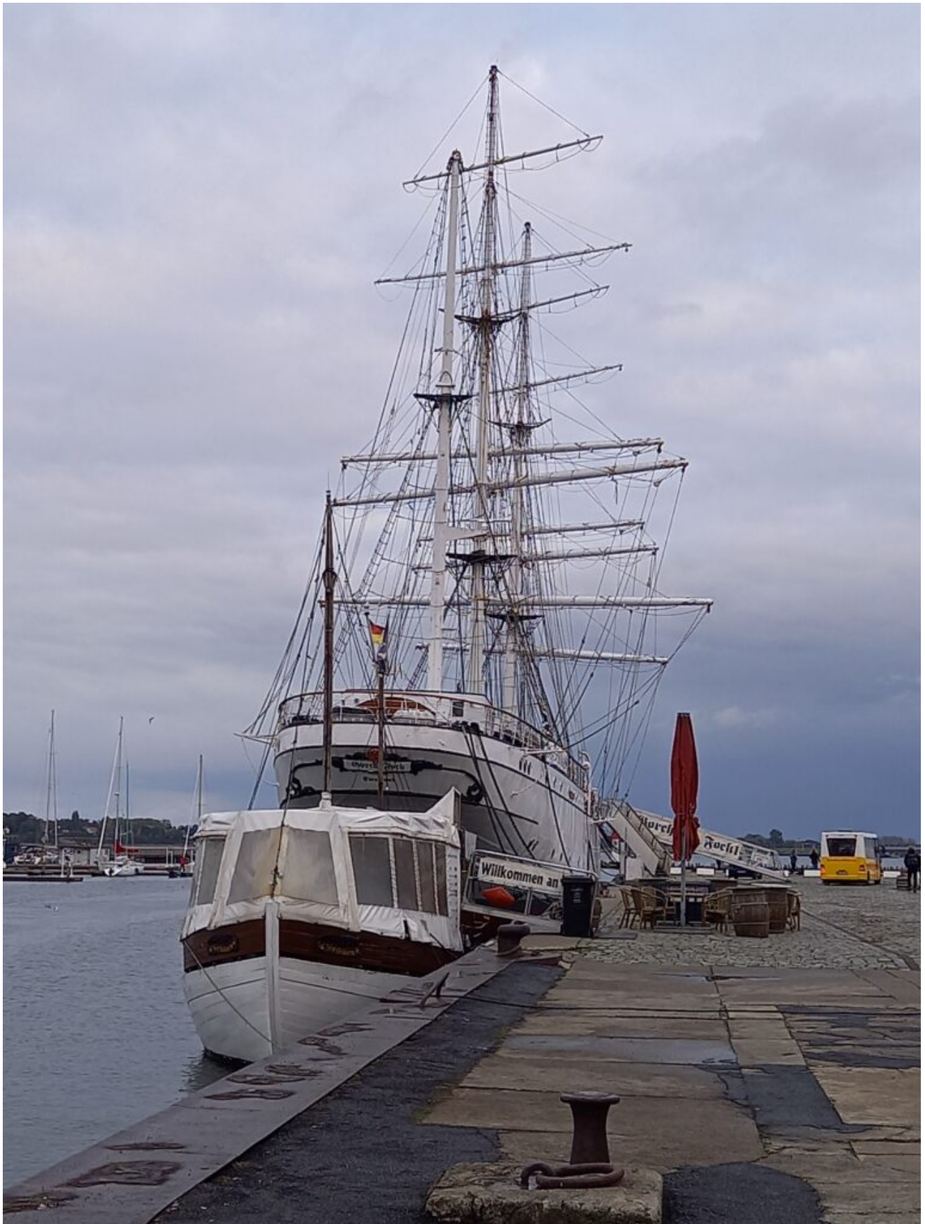
die Gorch Fock I das alte Segelschulschiff ist seit 2003 wieder an seinem Hafen