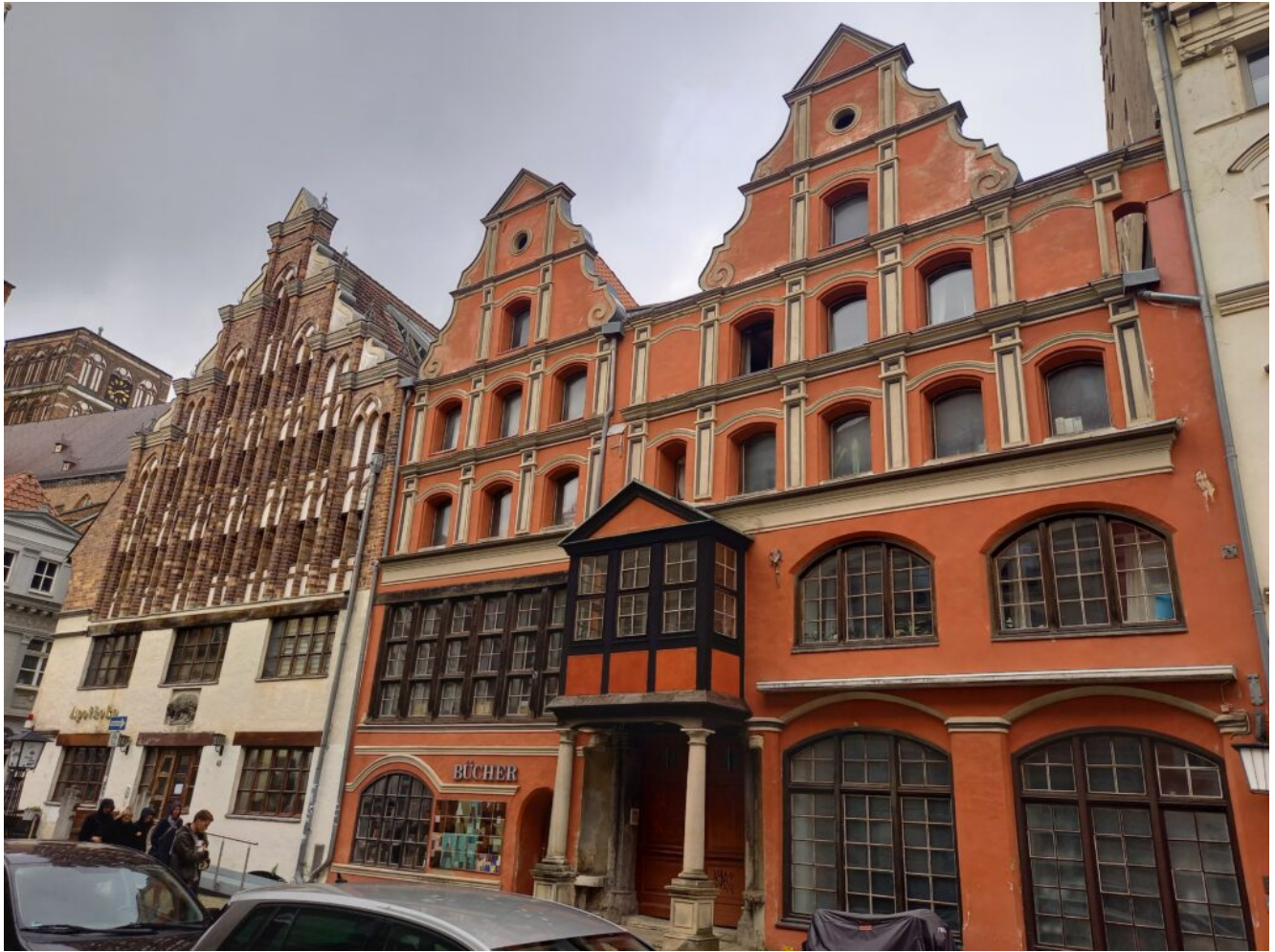
Barocke Bauten und Bürgerhäuser