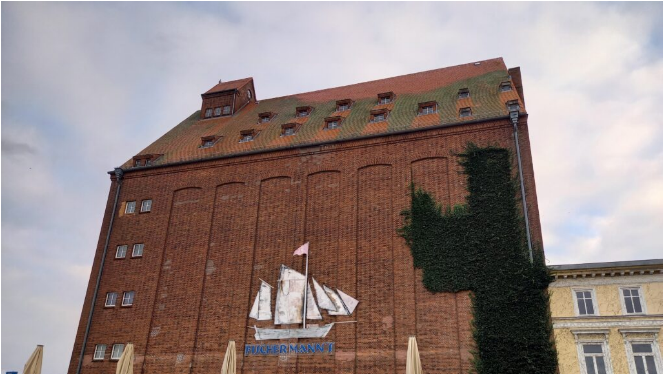
am Hafen finden sie alte Speicher in Backsteinoptik