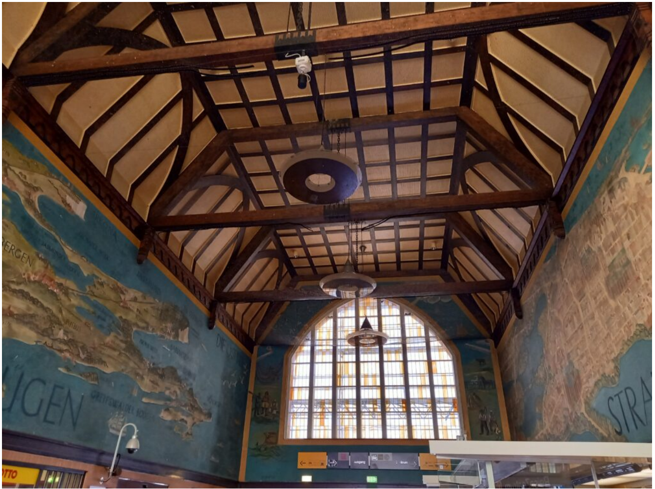
die beeindruckende Bahnhofshalle des kleines Bahnhofsgebäudes in Stralsund