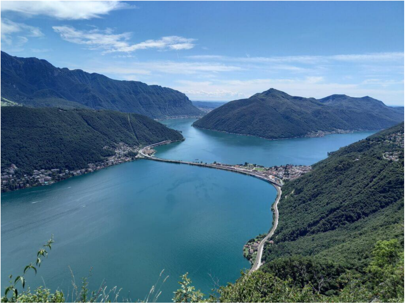
Blick vom Monte Bre auf Lugano