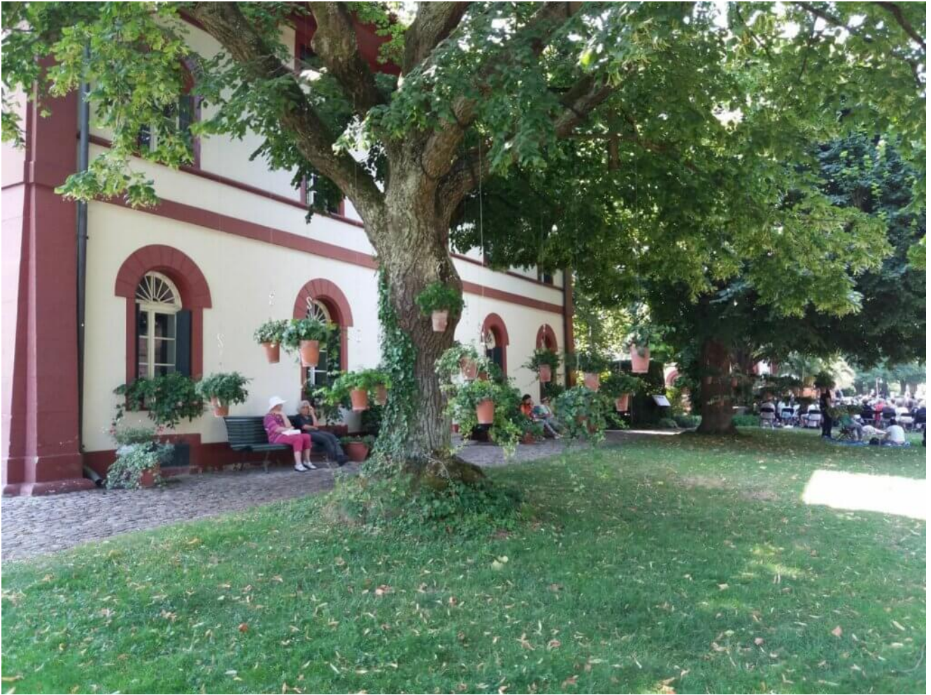
Der Botanische Garten von Erlangen