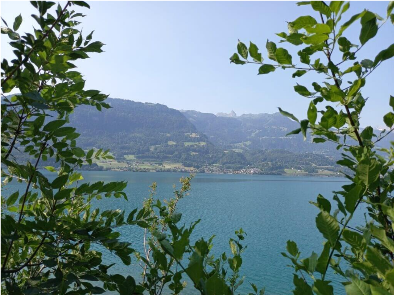
Quinten am Walensee Schweiz