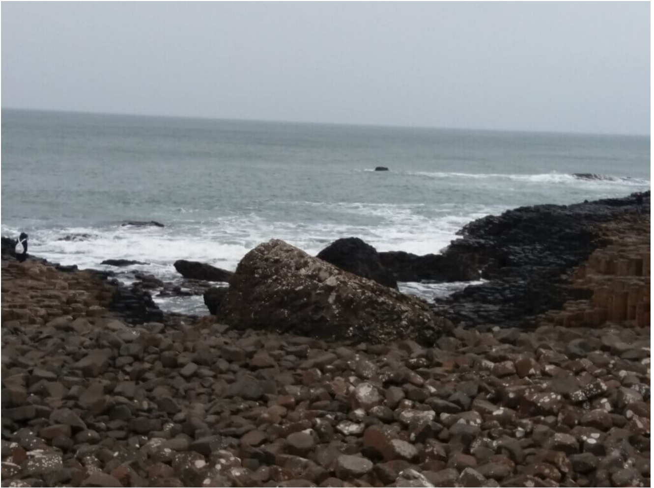
Giants Causeway Nordirland