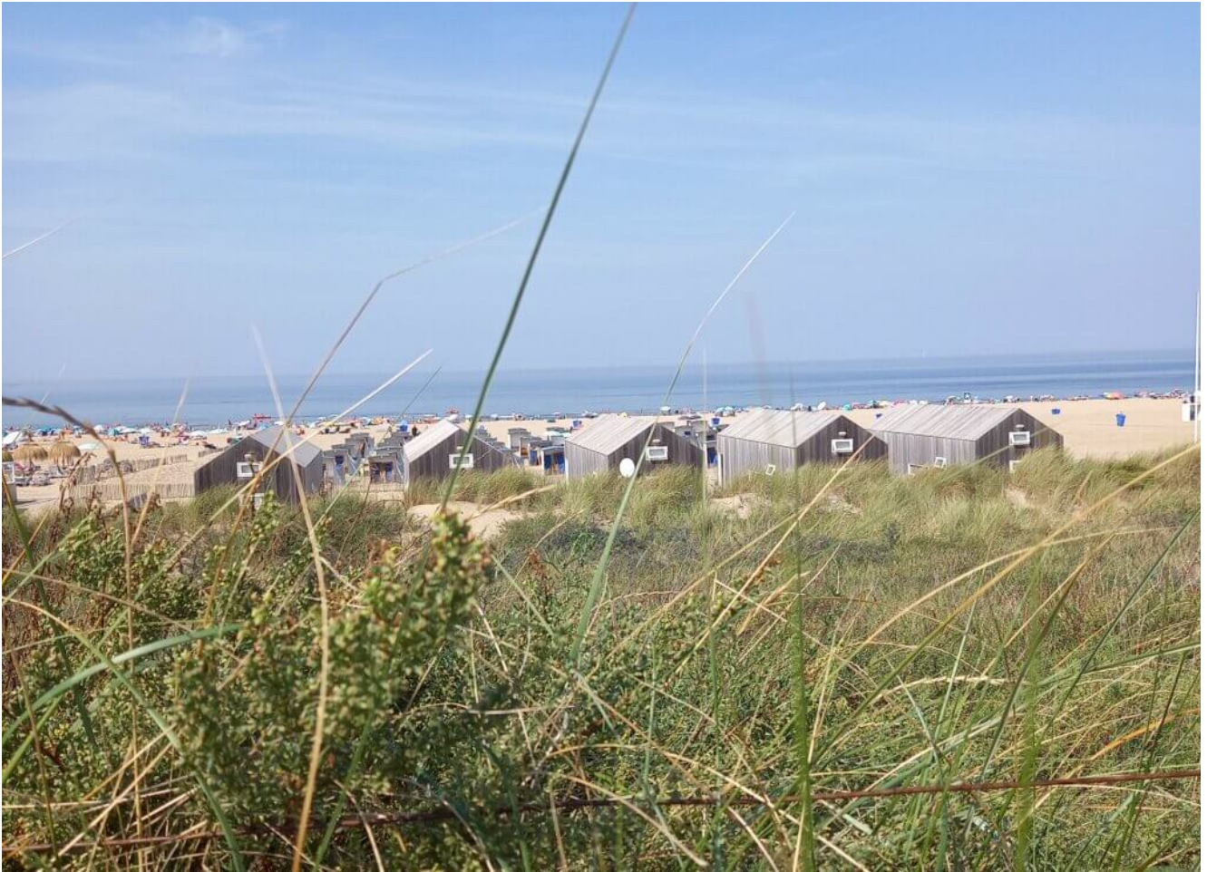
Katwijk an Zee