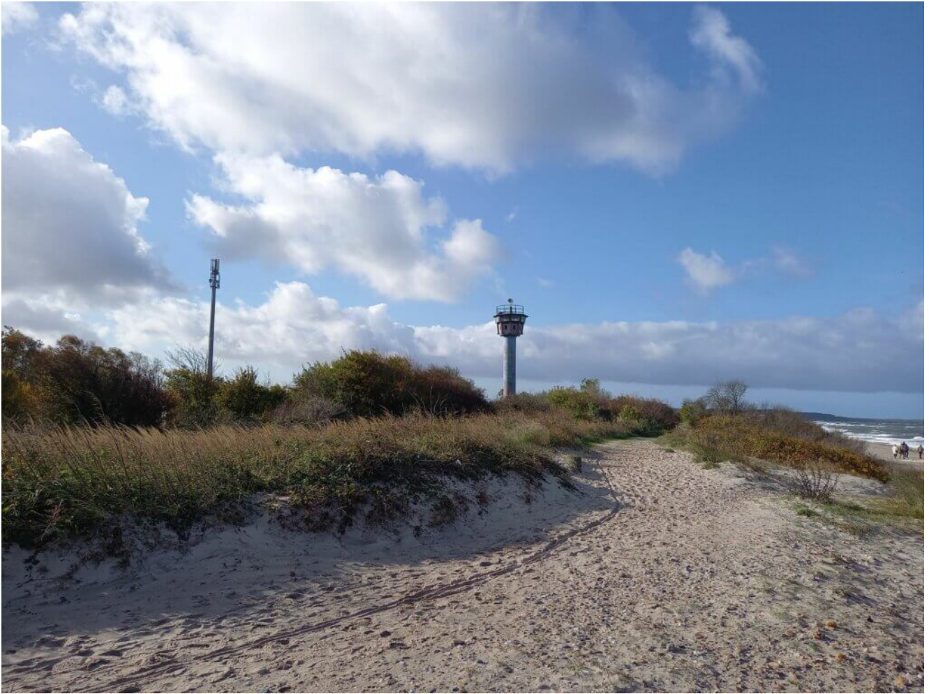
Bürgerende Wachturm ehemalige DDR