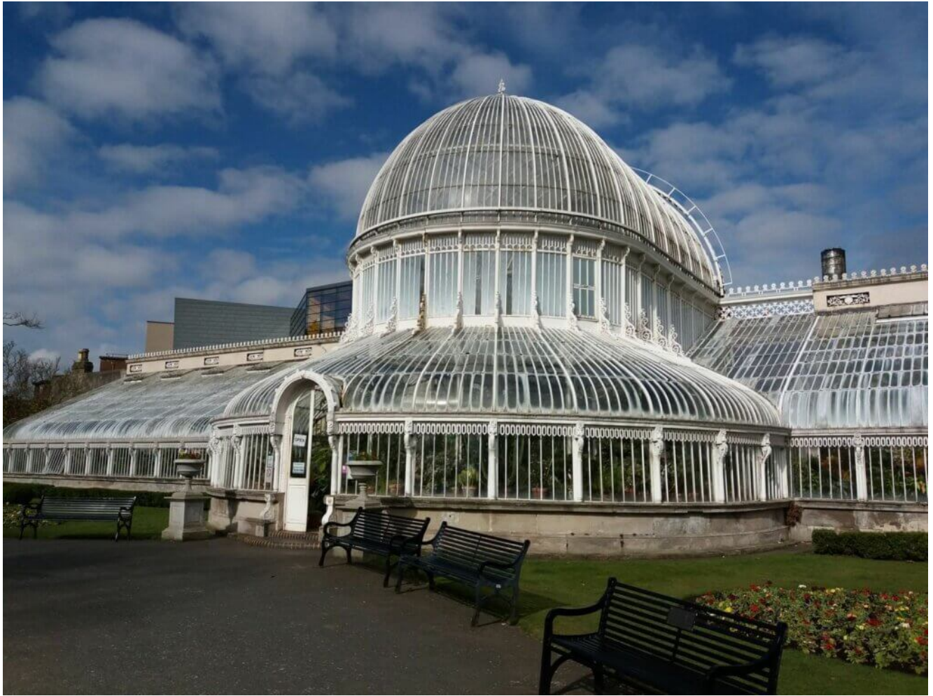
Botanischer Garten Porto