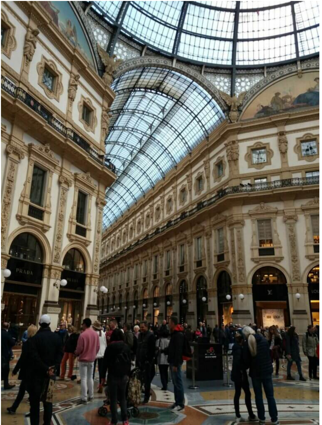
Die Einkaufsgallerie wurde nach dem König Vittorio Emanuele