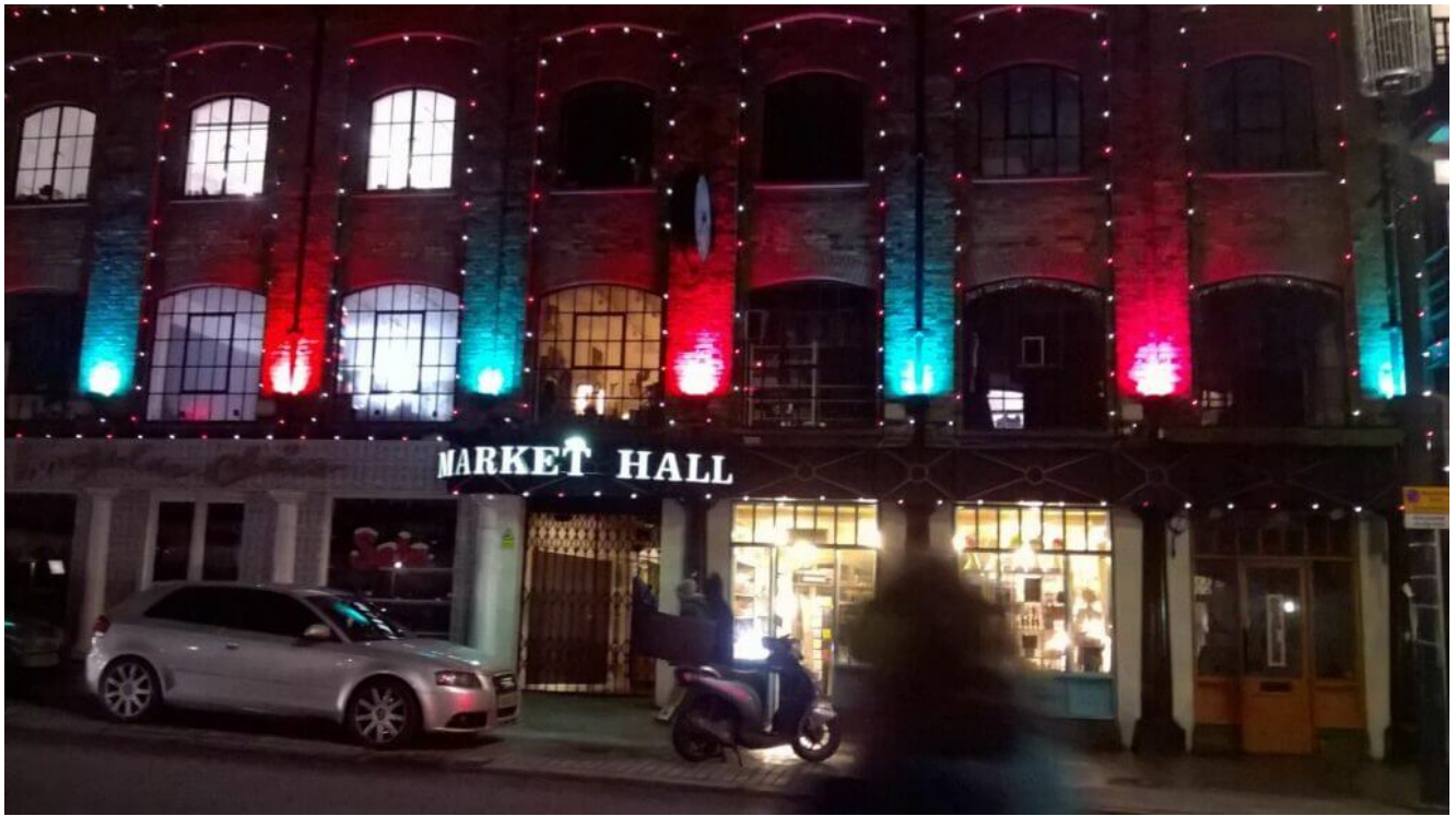
Camden Market London