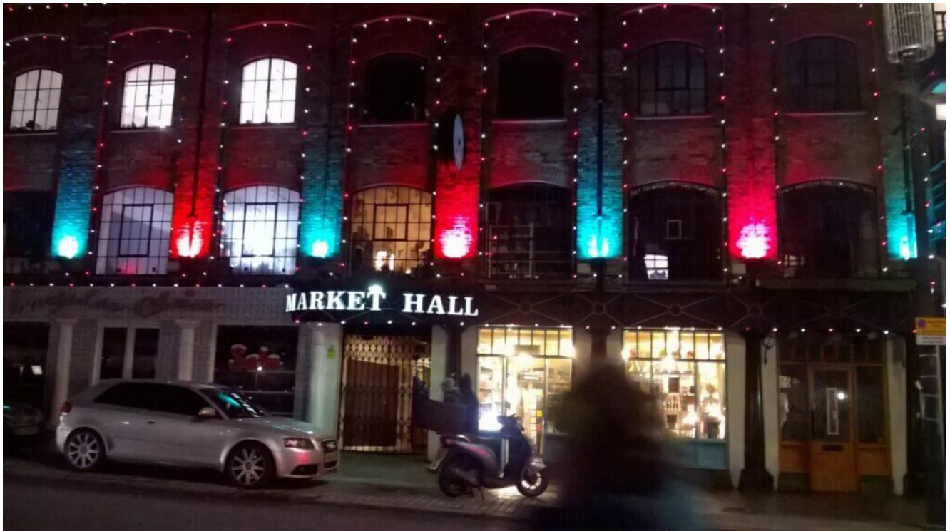
Camden Market London