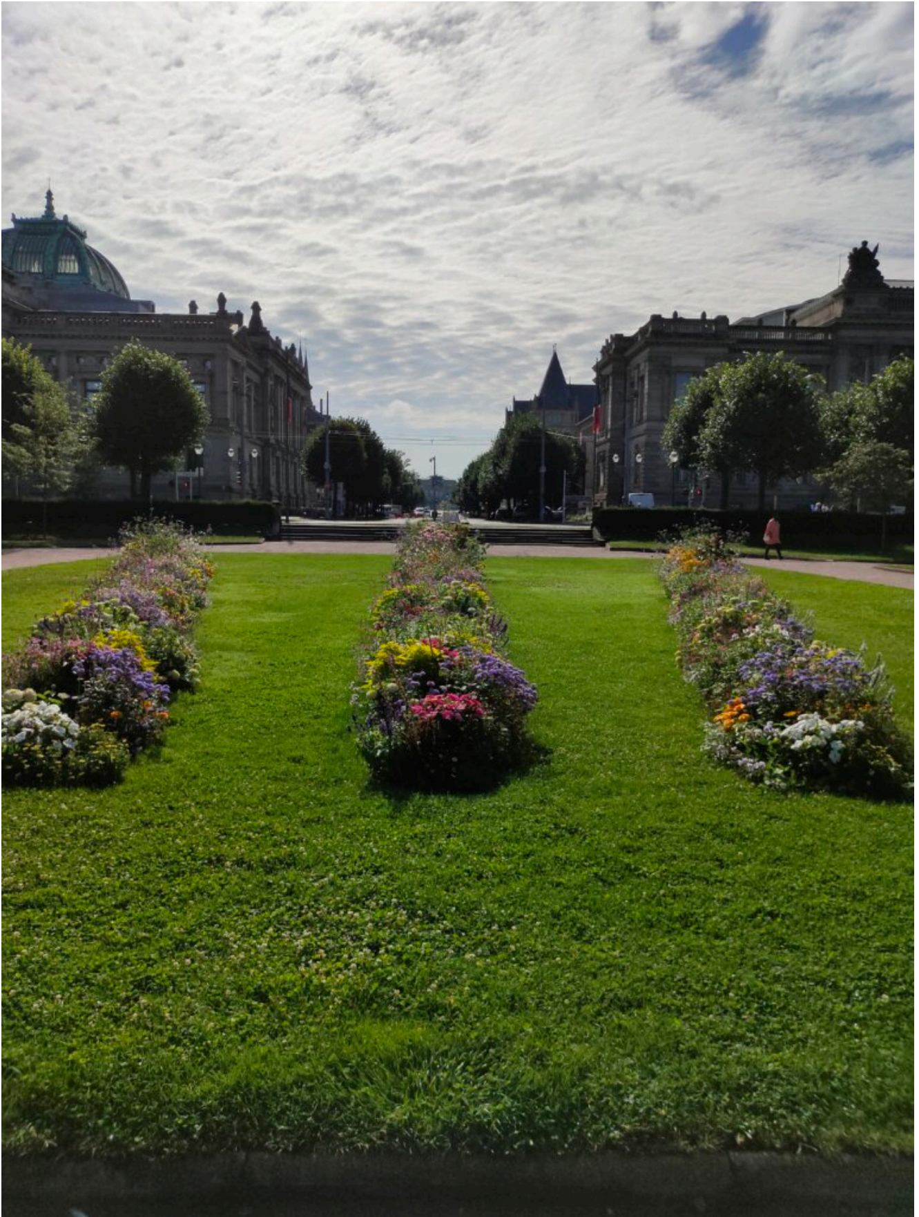
Place de la République

Monumentale Bauten und Prachtstraßen aus der Kaiserzeit. Darum wird es von den Straßburgern auch als das Deutsche Viertel