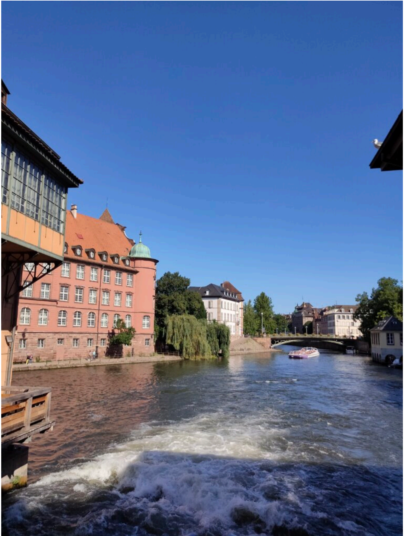
die Ill in Petite France