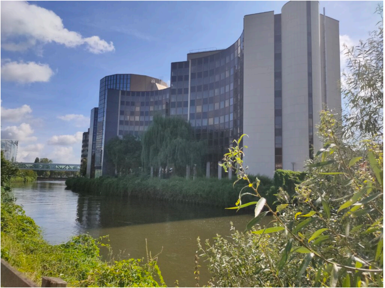
Straßburg Europäisches Parlament