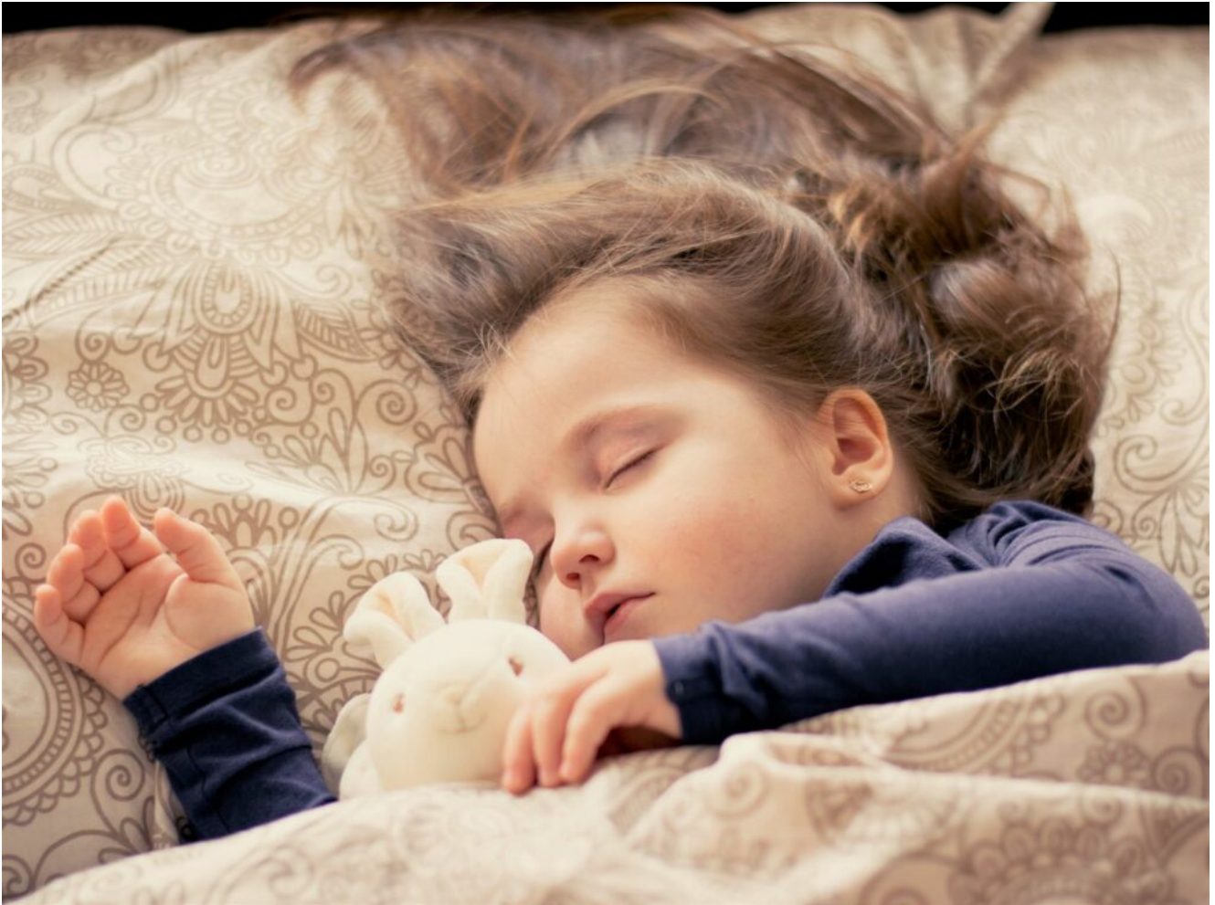
Mädchen mit Plüschtier

Du siehst gerne Filme und Serien, die in England spielen, historisch angehaucht wie „the Tudors“ oder „The Crown“ sind ? Dann gefallen dir vielleicht auch die englischen Vornamen .