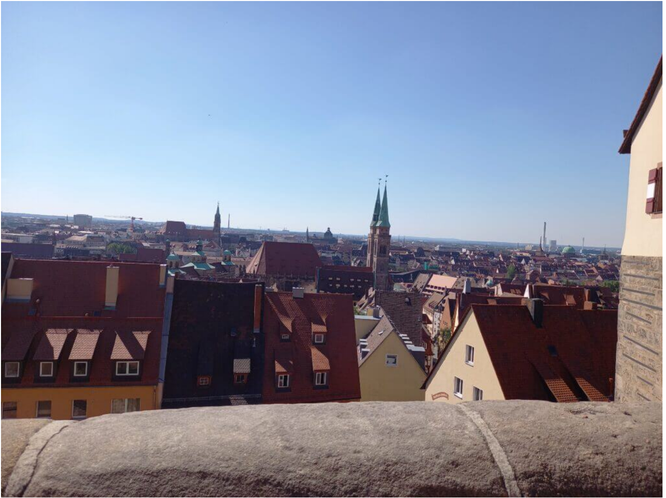
Blick vom Burggarten auf die Altstadt