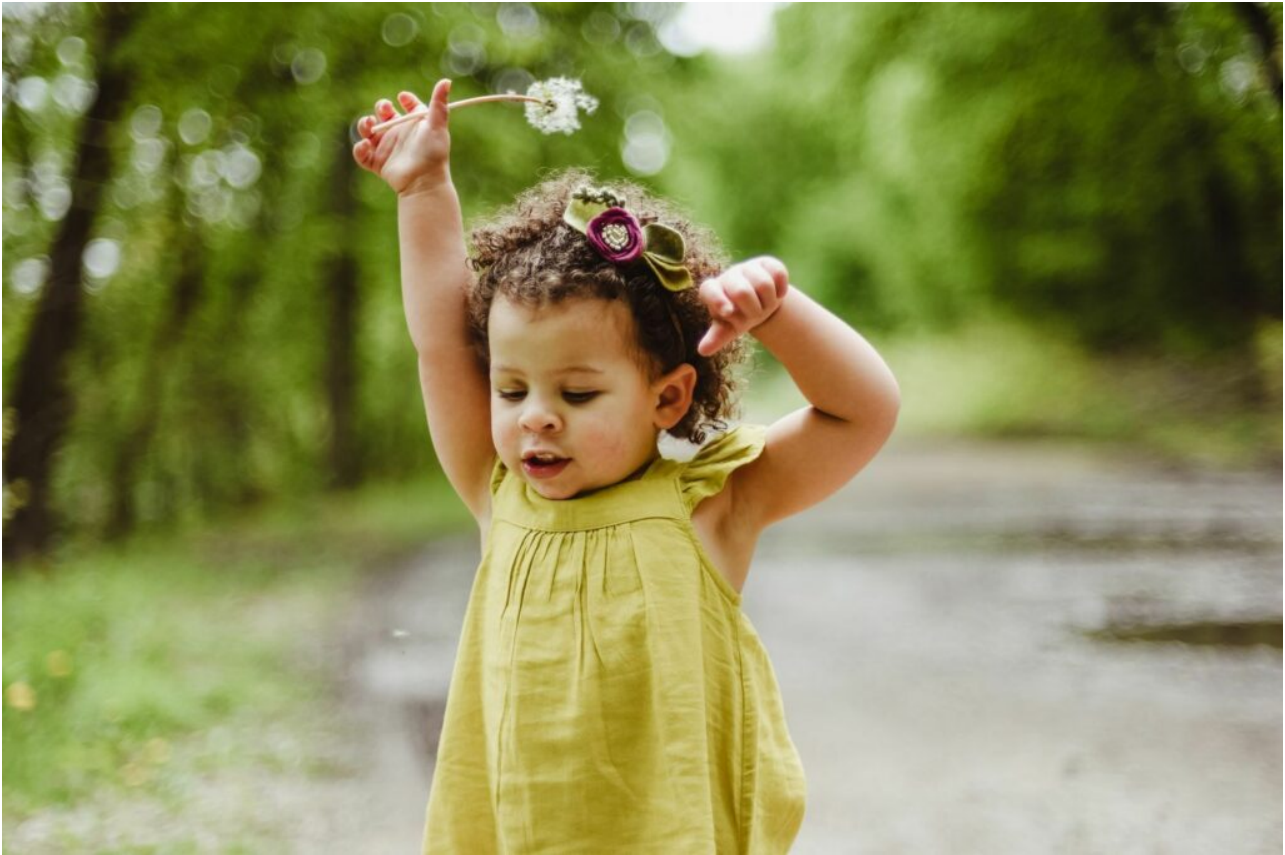
Mädchen im Sommerkleid