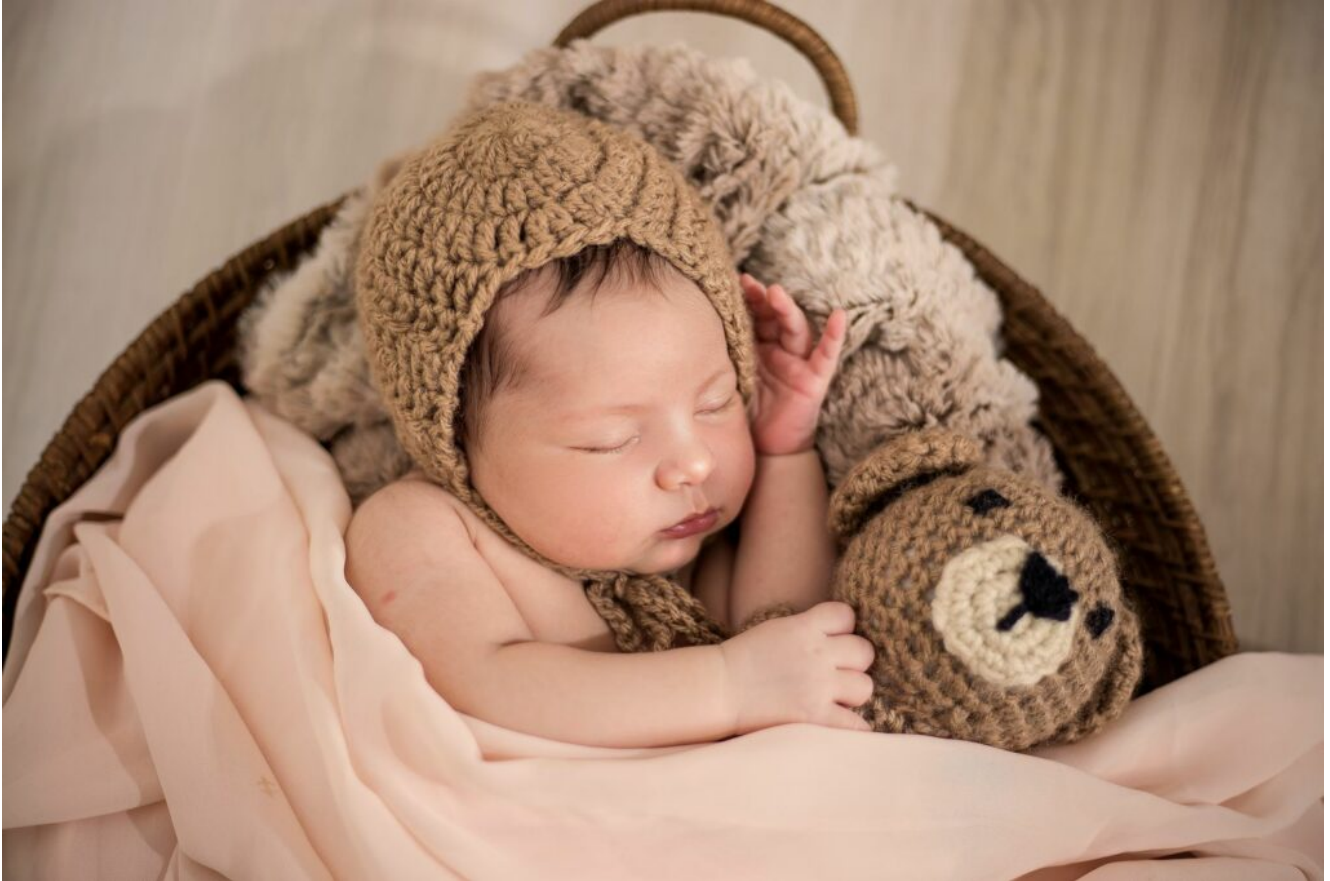
Baby im süßen Mützchen

Die Mädchennamen Jeanne und Marie waren letztes Jahr die beliebtesten Namen für die französischen Prinzessinnen.