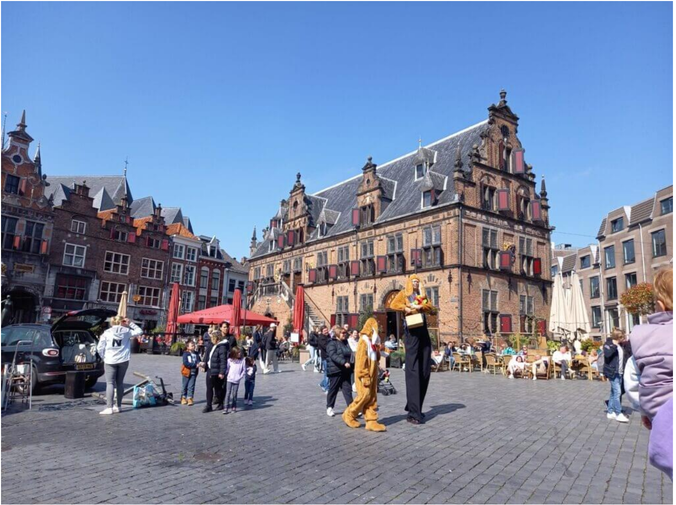
Marktplatz in Nimwegen

Gelderland liegt mittig der Niederlande, im Osten und ist die größte Provinz der Niederlande. Die Hauptstadt Gelderlands, Arnheim , hat eine bewegte Geschichte. Uns allen bekannt ist der Film „die Brücke von Arnheim“. Verfilmt wurde hier die Schlacht um Arnheim im Jahre 1944. Weitere bekannte Städte sind Nimwegen und Apeldoorn .