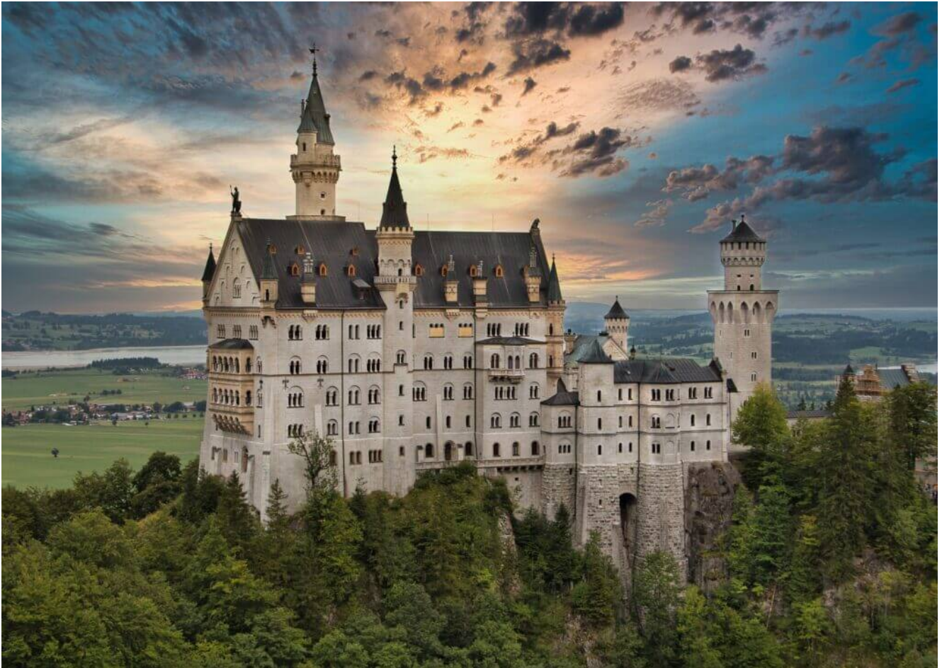
Schloß Neuschwanstein Märchenkönig Ludwig

Richard: Der Reiche und Starke, ist uns bekannt durch Richard Löwenherz, König Richard I. von England. Richard III. König von England war er nur zwei Jahre. Sein Leben wurde von Shakespeare in einem Drama " Die Tragödie von König Richard III. „verfasst.