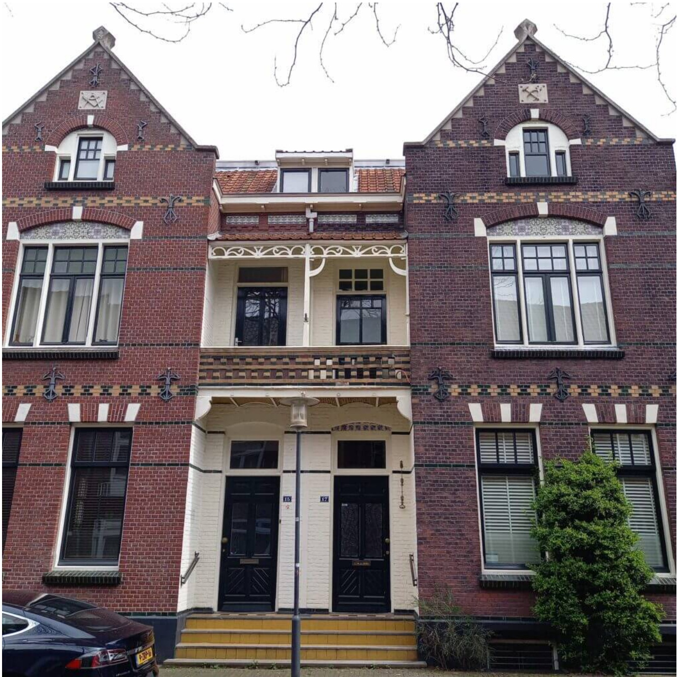
Schönes Haus in Eindhoven

Es liegt im Süden der Niederlande und grenzt an Limburg, Gelderland, Zuid-Holland und an das belgische Flandern. Die Hauptstadt ist 's-Hertogenbosch, kurz Den Bosch genannt. Die größte Stadt der Provinz ist Eindhoven , die Designstadt. Weitere bekannte Städte sind Tilburg und Breda . Breda ist eine schöne Altstadt, in der man herrlich shoppen gehen kann.