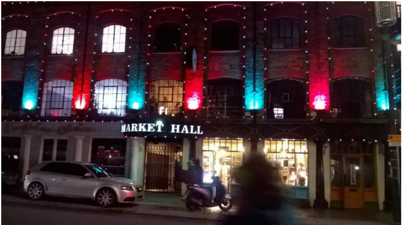
Camden Market London

Das könnte dich auch interessieren: Shoppingtour in London.