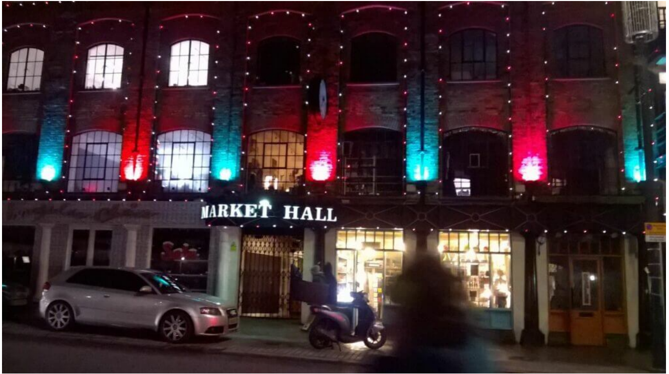
Camden Market London