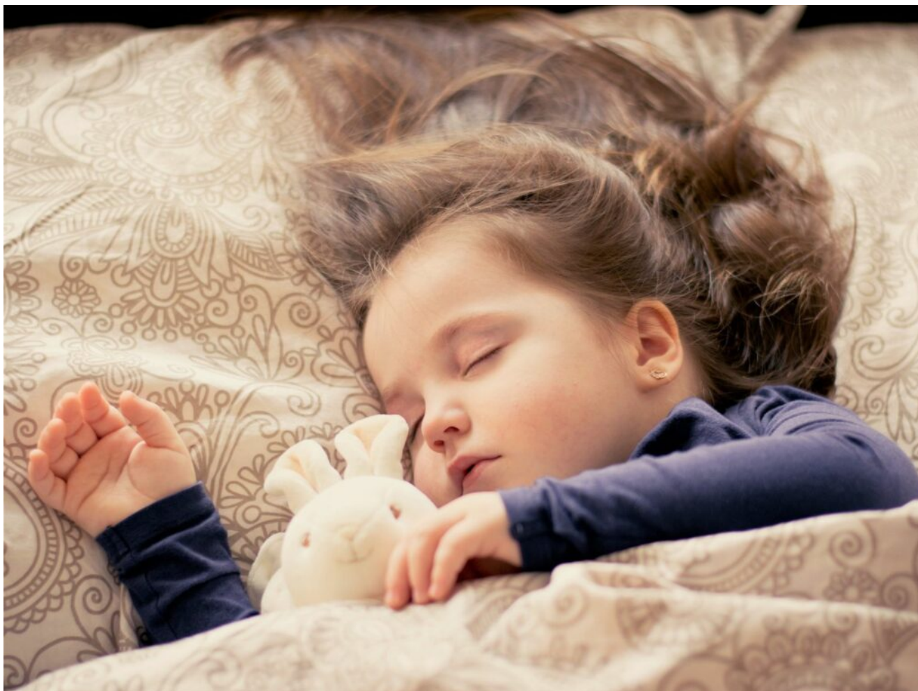
Mädchen mit Plüschtier

Du siehst gerne Filme und Serien, die in England spielen, historisch angehaucht wie „the Tudors“ oder „The Crown“ sind ? Dann gefallen dir vielleicht auch die englischen Vornamen .